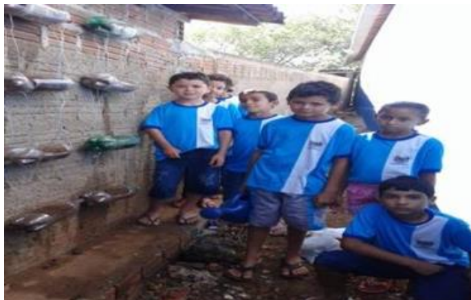
Horta suspensa resultado final.