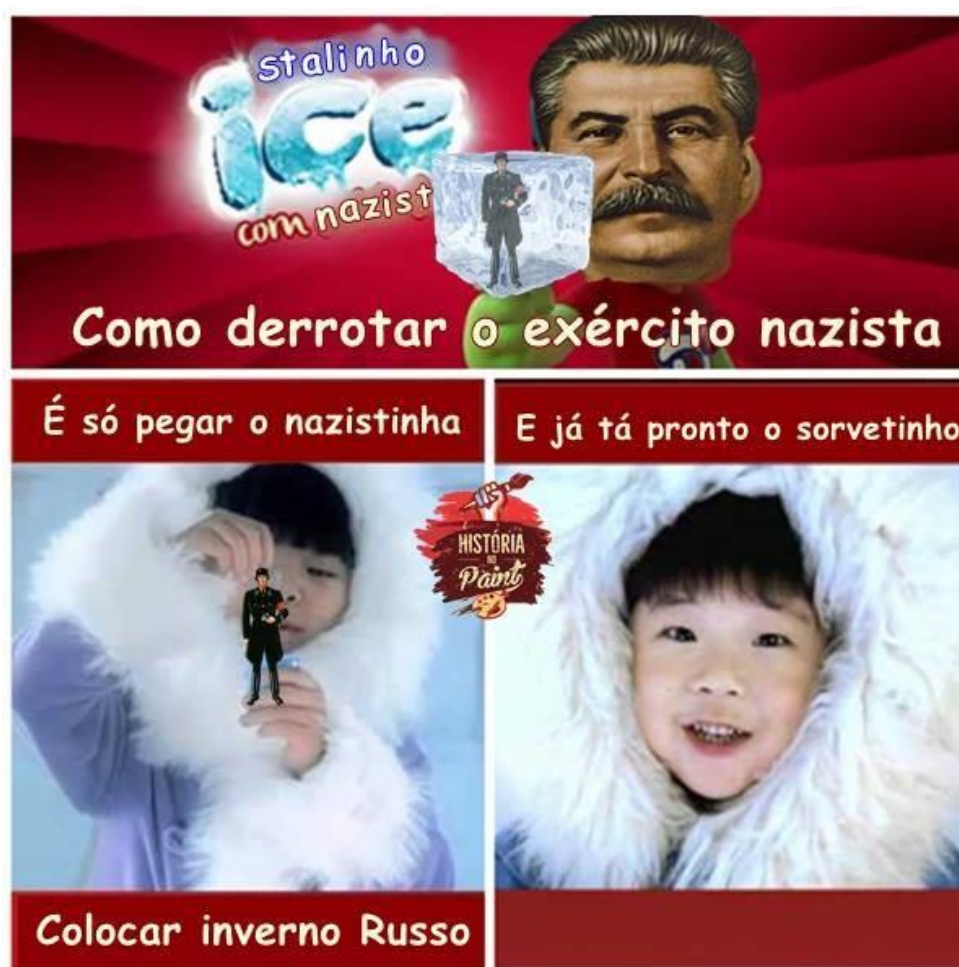
Figura 3 - O exército nazista e o inverno russo