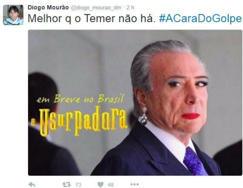
Figura 1 - Temer e o movimento do Impeachment

Meme é a mistura de imagens de personagens conhecidos, ou não, com frases engraçadas. É um humor bastante crítico, inteligente e que leva o consumidor a pensar sobre seus significados. Para compreender este tipo de produção artística é preciso conhecer o contexto histórico por trás de sua produção, identificando o posicionamento político, social e cultural de seu criador. Analisemos o exemplo a seguir: