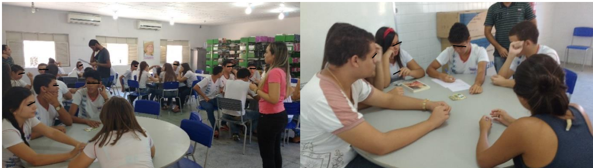
Figura 2. Aplicação do jogo e trabalho em grupo.

relativas às afirmativas correspondentes ao número. Como Kishimoto (2010) afirma, os jogos possibilitam a perceber a sensibilização do trabalho em grupo, nesse sentido, fizemos essa constatação. (Figura 2)