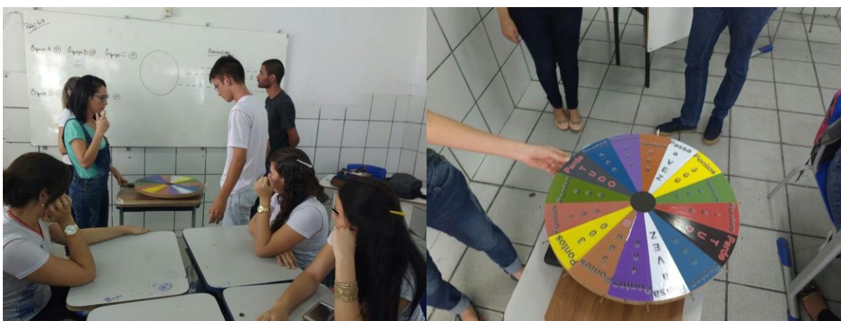
Figura 3. Aplicação do jogo.

Com regras bem simples e bastante conhecidas. Inicialmente os alunos foram separados em equipes, cada uma com 5 integrantes, logo depois teve sorteio para saber a ordem das equipes e então o jogo teve início (figura 3): um representante de cada equipe rodava a roleta e falava uma letra por determinado valor, previamente fixado no quadro branco, pontuando se tivesse a letra, vale lembrar que as palavras estão no quadro só com a quantidade de letras e uma pista. A equipe vencedora é a que acertar mais palavras e consequentemente tiver maior pontuação. As palavras versaram sobre conteúdos de bioquímica e ao mesmo tempo o professor foi tirando as possíveis dúvidas que surgiam a respeito do assunto.