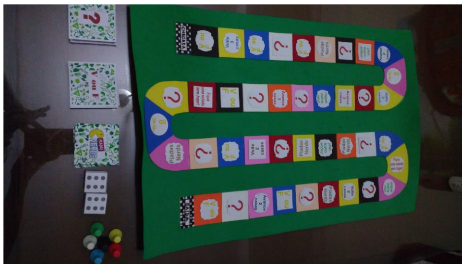
Figura 4. Jogo de tabuleiro.

O conhecimento prévio dos alunos a respeito das temáticas foi mediado através do professor, que assume esse papel importante de unir o prévio ao conhecimento científico (CONDE et al., 2013).