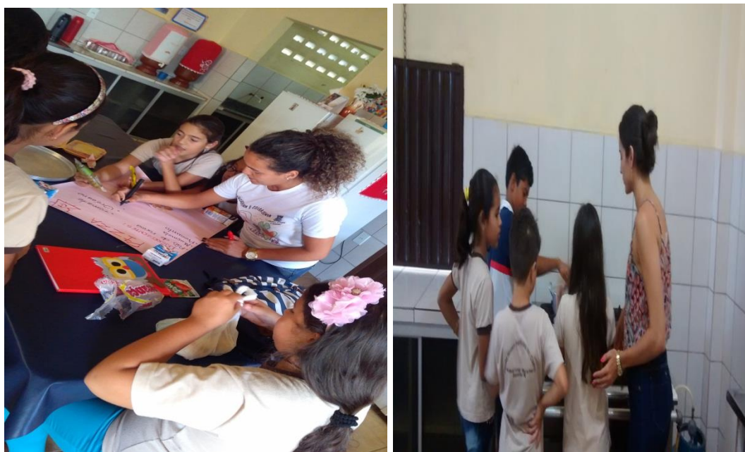
Imagens 03 e 04: Acervo pessoal dos estagiários.

A autora enfatiza que as estratégias de leitura são procedimentos que o leitor utiliza para controlar o processo de compreensão de um texto, tendo uma maior percepção de sua função. Estando a partir daí a importância de trabalhar e vivenciar a construção do processo.