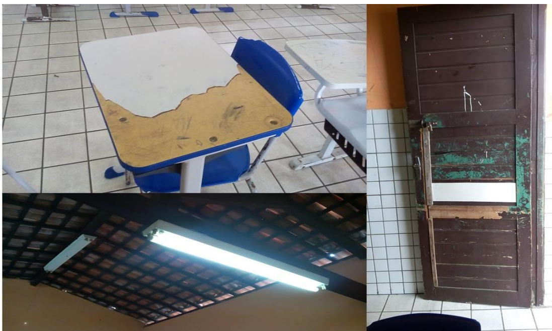
Foto: Carteira, porta e lâmpadas encontradas em sala.

A idade dos alunos eram bastante variáveis, tinham desde pessoas próximas da maior idade a crianças. Ao todo a turma possui 18 (dezoito) discentes, sendo quatorze (14) meninas e apenas quatro (4) meninos. O que impressionou durante as observações, apesar da baixa quantidade de alunos na sala foi a falta de educação dos mesmos com eles próprios e com o professor de geografia, o relato destas observações podem ser analisadas nos roteiros de observação.