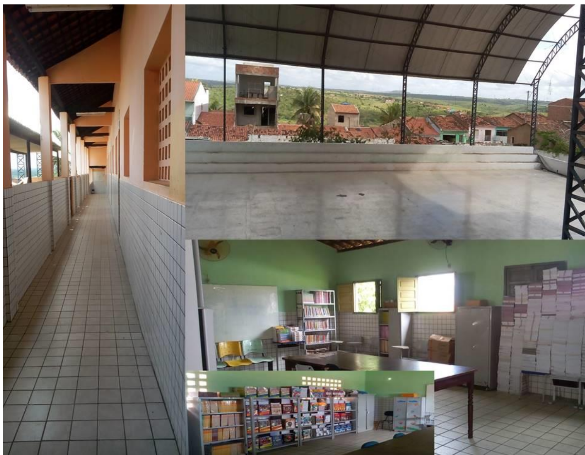
Foto: Corredor da escola, quadra de esportes e biblioteca.

ampliação e outros investimentos, não possui auditório, sala de professores e sala de vídeo, onde quando necessitado é preciso improvisar áreas inapropriadas da escola, como quadra de esporte, refeitórios e até salas de aula. Existe uma biblioteca que contém livros didáticos e literários, mas que não são aproveitados pelos alunos por falta de interesse e motivação por parte da escola, os professores também pouco usam este espaço, estando na maior parte do tempo fechado. Esse caso também acontece com a sala de informática.