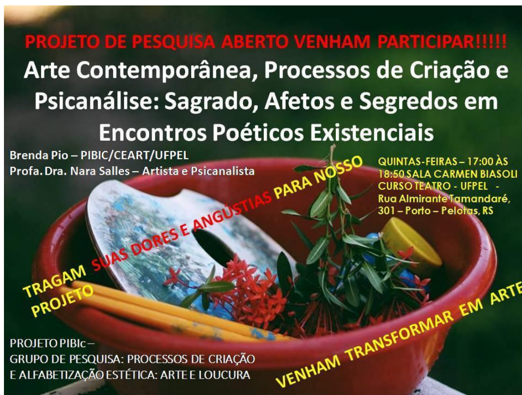
Imagem 02: Cartaz de chamada para o projeto

Estamos promovendo metodologicamente uma ação dialógica entre Instauração Cênica, Psicanálise e Artes, imbuídos na compreensão da dimensão existencial humana, fenômeno complexo que abarca um universo de disciplinas e especificidades no levante de questões sobre o ser humano e suas inquietações no mundo. Entendemos que falar do fenômeno do transtorno mental requer compreensão da dimensão existencial humana e dos processos inconscientes, que são estudados pela psicanálise. Compreendemos que para a construção de conhecimentos sobre o fenômeno da saúde mental no campo da Arte se faz importante uma metodologia em que os encontros, os afetos e os segredos junto as poéticas estejam presentes no trajeto para que possamos transitar nas questões pertinentes a existência humana. Importante destacar que estamos