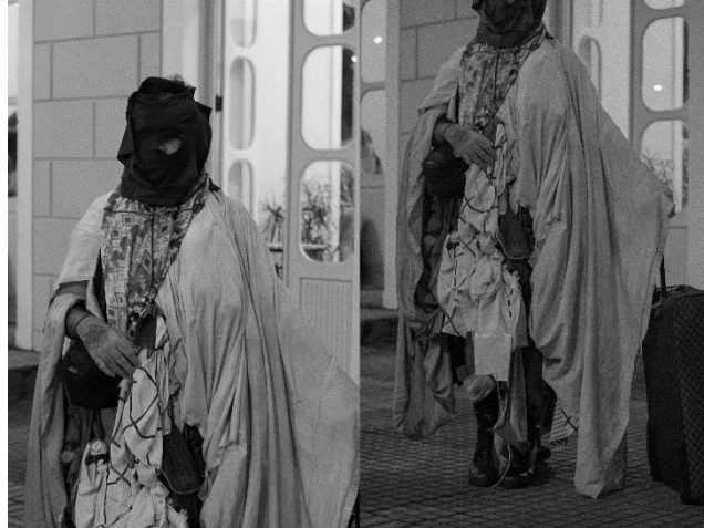
Figura 4 Registros da performance no Festival MOTIM. Fotografia: Mateus Falcão (2019)

O terceiro momento foi uma experimentação em conjunto com alunos e alunas da EEMTI Telina Barbosa da Costa, além de alguns integrantes da formação inicial da performance. Nessa ocasião, trilhamos da Escola até uma praça próxima, denominada Praça da Messejana (bairro que abrigou a ação). Na ocasião, houve filmografia de toda a experiência, feita pelo artista-pesquisador Mateus Falcão.