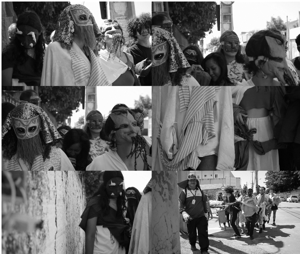
Figura 5 Registro da performance pelas ruas da Messejana.

O terceiro momento foi uma experimentação em conjunto com alunos e alunas da EEMTI Telina Barbosa da Costa, além de alguns integrantes da formação inicial da performance. Nessa ocasião, trilhamos da Escola até uma praça próxima, denominada Praça da Messejana (bairro que abrigou a ação). Na ocasião, houve filmografia de toda a experiência, feita pelo artista-pesquisador Mateus Falcão.