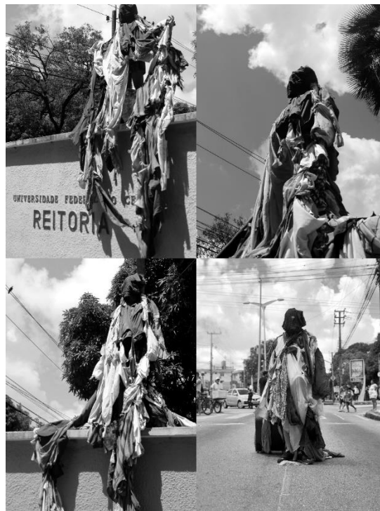
Figura 6 Fotos de Retralhas durante manifestação contra os cortes na Educação.

O quarto diálogo da Teia com a cidade foi no dia quinze de maio, durante uma manifestação no Bairro Benfica, como já foi citado. Na ocasião, dialogamos com o espaço universitário e com os muros da Reitoria, construindo uma imagem que foi identificada por muitas pessoas como indicando sobre a precarização da educação superior pública pelo Governo neoliberal e conservador em vigência.