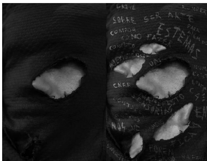
Figura 2 Fotografia e experimentação de edição de apresentação da "Teia" no Festival Motim. Autorxs: Mateus Falcão e Levi Mota Muniz, 2019

Esse retorno da vida à vida torna-se palpável no ato performativo: este que funda maneiras de existir ao mesmo tempo que se exerce. Seria impensável, numa esfera convencional e normatizada da expressão de gênero, a utilização de uma vestimenta composta por quarenta roupas cortadas. Isso só se torna viável e vivível no momento em que se performa. Performar é expandir as maneiras de se viver, escancarando e esgarçando as estruturas que sufocam as existências (FABIÃO, 2013). Performar é explodir e potencializar a experimentação de gênero.