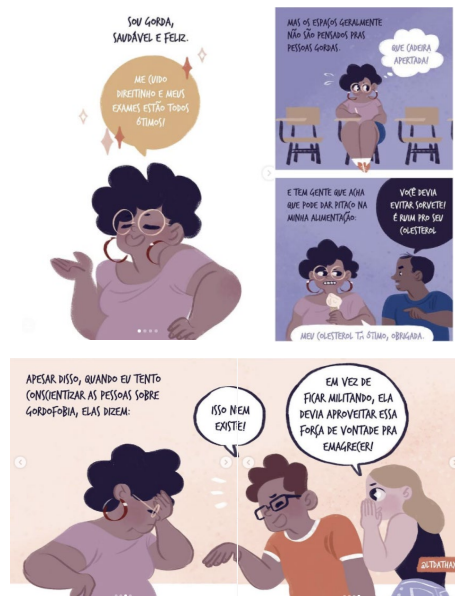
Figura 3 – Tira “Sou gorda, saudável e feliz”