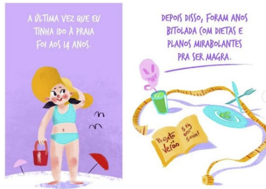
Figura 1 – Trecho de tira sobre aceitação do corpo