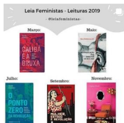
Figura 01- Folder de divulgação dos livros do clube.

Os encontros foram propostos para acontecer de dois em dois meses sendo o primeiro encontro oficial em março de 2019. No primeiro ano de clube foram lidos 5 livros de abril à novembro, iniciando com O Calibã e a Bruxa da Silvia Federici, seguido de: Reivindicações dos Direitos da Mulher de Mary Wollstonecraft, O ponto Zero da Revolução de Silvia Federici, e Um teto todo seu de Virginia Woolf, ver figura 02. Durante os encontros as mediadoras iniciam fazendo a introdução sobre a autora e o livro é comentado capítulo a capítulo. As intervenções podem ocorrer de forma fluída com mulheres levantando dúvidas e reflexões, ou sendo puxadas pela mediadora ao fim de cada explanação dos capítulos.