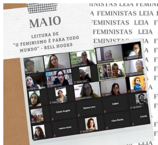
Figura 03-Primeiro encontro online- maio.