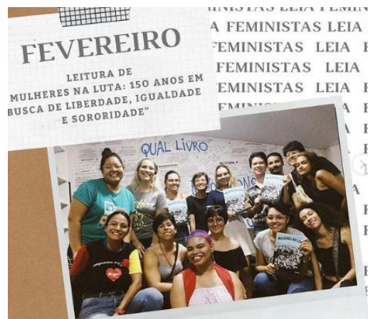
Figura 02 -Último encontro presencial-fevereiro.

Com o lançamento de livros de feministas brasileiras por cada vez mais editoras, o clube começa também a fazer um resgate da memória de escritoras brasileiras como Nísia floresta, Lélia Gonzales e Carla Cristina Garcia, importantes para o entendimento do pensamento feminista no brasil, e de uma construção voltada para o cenário nacional.