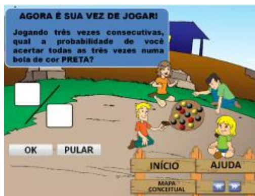
FIGURA 07. Questão 18 do Modelo A

Na primeira tentativa, a dupla Mandy e Xena, respondeu serem três chances em 14 bolas, “ 3/14 ”, o que deixa ainda um pouco a desejar sobre o conhecimento da multiplicação de probabilidades. Já a dupla Blair e Nyce, respondeu usando a multiplicação das probabilidades, porém esqueceu de sair retirando a quantidade de bolas pretas que já havia considerado ter acertado. A resposta da dupla foi: “ 7/14 \cdot 7/13 \cdot 7/12 = 343/2184 ” (BLAIR, NYCE).