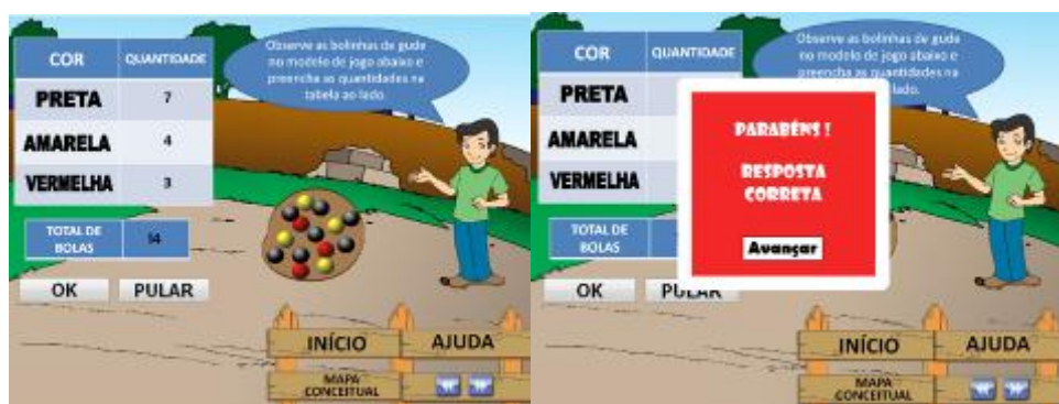
FIGURA 01. Validação da resposta do aluno na Questão 1 do Modelo A

As duplas acertaram esta questão logo na primeira tentativa. A Fig. 04 mostra a validação de suas respostas.