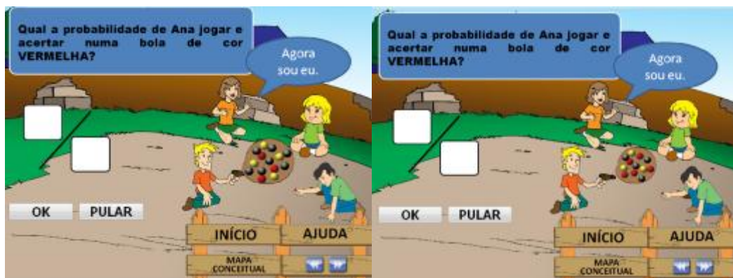
FIGURA 03. Questão 9 do Modelo A e do Modelo B, respectivamente.

Nesta questão, o problema apresentado está mais aproximado do cálculo de probabilidade, de modo que o aluno para responder, deveria estar atento às quantidades, tanto do evento em questão quanto do total (espaço amostral). No entanto, a contagem de cada evento possível e do total de possibilidades, bem como a ideia do que tem mais chance de ocorrer, que são conceitos importantes para o cálculo de probabilidade, foram contemplados nas questões anteriores, dessa forma, para o cálculo da probabilidade nesta questão, as duplas não sentiram dificuldades. Responderam o resultado de forma rápida e por se tratar de um resultado em forma de fração, não sentiram dificuldades, pois, o OA já traz em sua interface a ideia de escrever o resultado dessa forma, o que torna o Objeto de Aprendizagem um material potencialmente significativo no momento em que estimula o aluno a fazer uma ponte entre o que ele sabe e o que ele precisa aprender, indo de encontro ao pensamento de Ausubel (2003) no que se refere às condições necessárias para que se ocorra a Aprendizagem significativa.