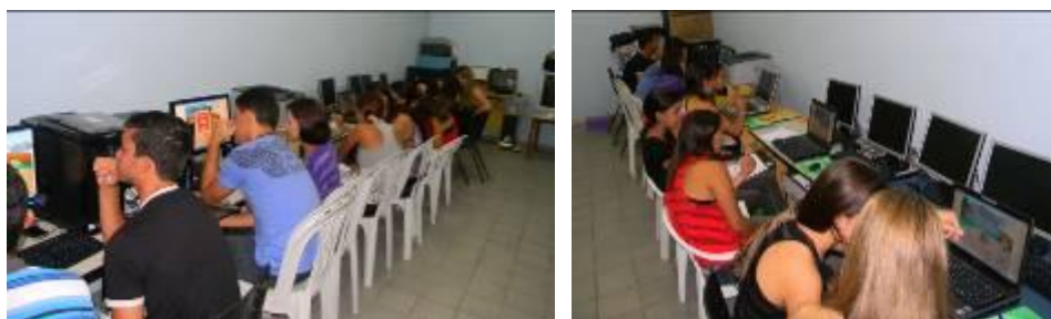
FIGURA 10. Alunos no momento do uso do OA Probabigude.

Por outro lado também pudemos destacar a interação entre o usuário-máquina (aluno-computador), que fez com que o aluno se sentisse o próprio construtor de seu conhecimento, que é o desejado, mas nem sempre é o que acontece nas aulas, destacando o pensamento de Papert (2008) que defende o uso do computador, ressaltando que um uso bem planejado do mesmo estimula os alunos e professores a avançarem em seu conhecimento de forma interativa e dinâmica.