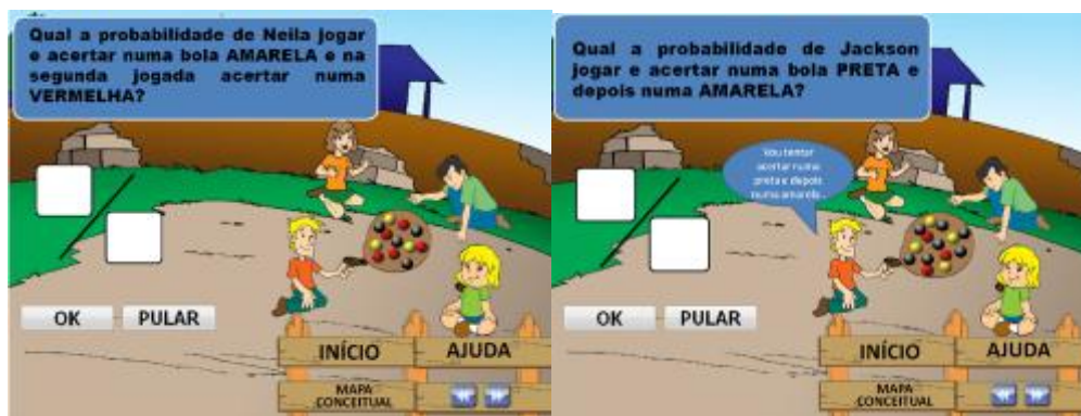
FIGURA 06. Questão 15 do Modelo B e Questão 16 do Modelo A