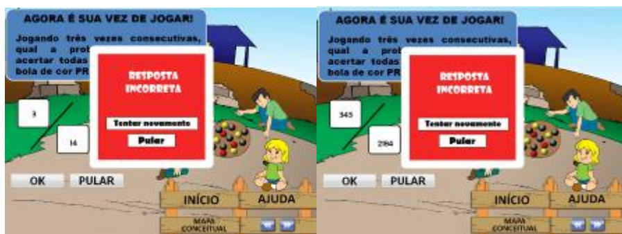
FIGURA 08. Exemplo do erro das duplas na questão 18 do Modelo A.