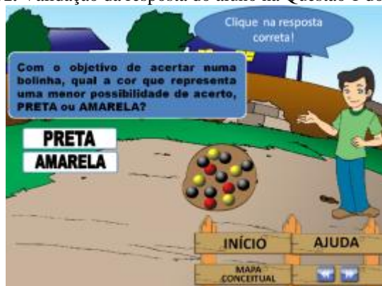
FIGURA 02. Questão 2 do Modelo A

Esta questão trazia consigo a ideia da quantidade de possibilidades que é muito importante para o entendimento do conceito de probabilidade.