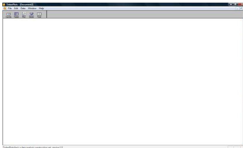
FIGURA 01 – Tela inicial do software TinkerPlots

O software oferece facilidade no registro dos dados, inclusive para a necessidade de correções, pois caso um dado seja alterado dentro de alguma ferramenta, por exemplo, Cards ou Table , automaticamente, será atualizado nas outras.