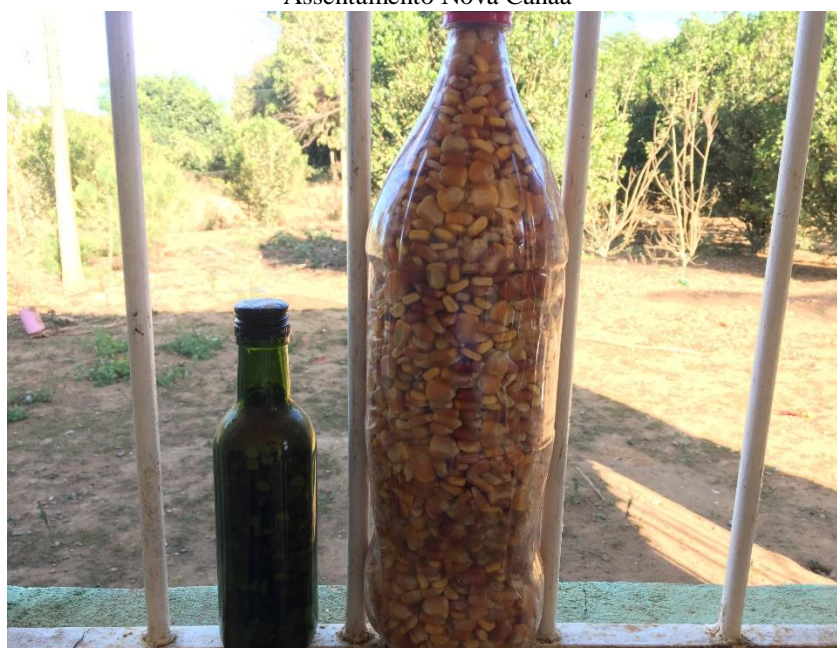
Figura 05 - Sementes armazenadas em garrafa pet para compor o banco de sementes familiar, Assentamento Nova Canaã

Um dos desafios para continuidade da Agroecologia no território é o acesso as sementes. Algumas famílias têm seu próprio banco de sementes em casa, que é o caso de uma das assentadas que guarda cerca de 04 variedades de milho (Figura 05), já outras pessoas compram suas sementes no centro da cidade. Um dos assentados que troca sementes com seus parentes, vizinhos e companheiros, se destaca, nesse sentido, pelo maxixe liso, plantado com a semente trazida pela sua avó da região semiárida, e que sua família vem cultivando na Zona da Mata desde então.