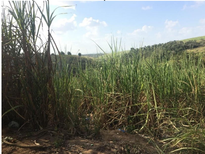
Figura 04- Cana de açúcar presente em uma das parcelas visitadas em Assentamento Nova Canaã

em outro canto” (AGRICULTOR E ASSENTADO 11, 2019). Outro agricultor complementa: “A cana é nossa, o INCRA não liberou ninguém a plantar cana, plantamos por conta da gente, não foi por conta de usina, por que precisamos para consumir e para vender, pra ganhar um extra” (AGRICULTOR E ASSENTADO 1, 2019).