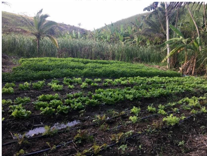
Figura 02 - Parte da diversidade de hortaliças e fruteiras na parcela do assentado e agricultor 1 no Assentamento Nova Canaã

café, couve-flor, tomate, graviola, cebolinha, jaca, fava cocora, araquá, fava rama, côco, acerola, pimenta malagueta, pimenta biquinho, laranja, caju, capim santo, hortelã, mamão, pepino, urucum, limão e outras (Figura 02).