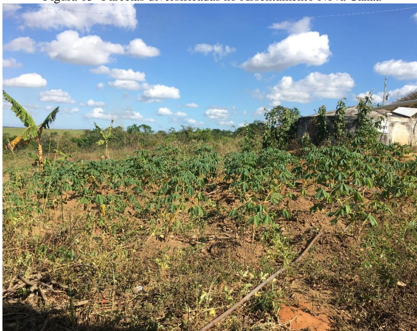
Figura 03- Parcelas diversificadas no Assentamento Nova Canaã

A diversidade agroecológica permite interações e equilíbrio entre plantas, animais e pessoas, proporcionando a produção de alimentos saudáveis, troca de experiências e saberes, renda familiar, soberania e segurança alimentar, conservação da natureza e a dependência mínima do sistema opressor capitalista. A figura 03 mostra a diversificação de outra parcela do Assentamento na qual foram encontrados pés de mamão, côco, macaxeira, laranja, feijão, banana, limão, berinjela e fava em três hectares.