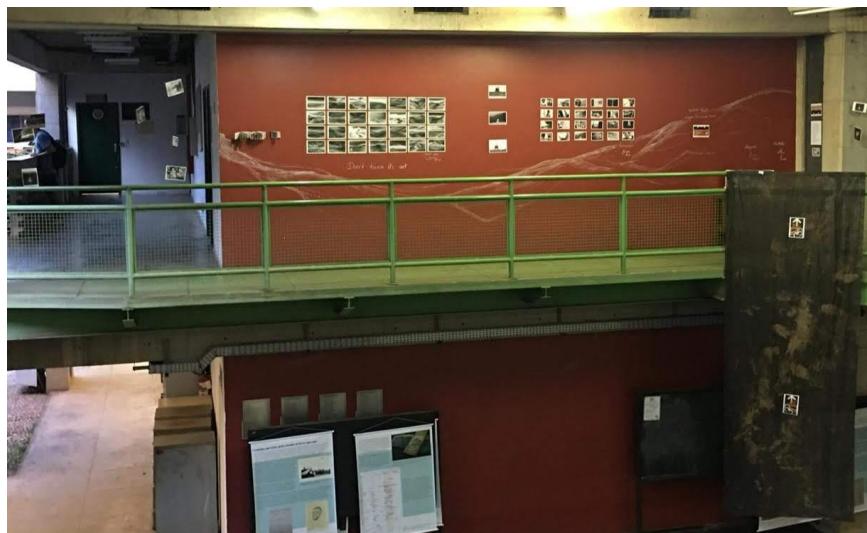
Figura 5. Foto da exposição intitulada “Rota de fuga” concebida, organizada e apresentada pelos alunos como finalização da disciplina em novembro de 2019 no IGC /UFMG

Juntos, mas cada um através da sua sensibilidade e habilidade, conceberam, organizaram e expuseram o resultado na exposição - no Instituto de Geociências da UFMG - que intitularam “Rota de fuga”, título escolhido como forma de se indignar pela situação dessas comunidades (FIGURA 5).