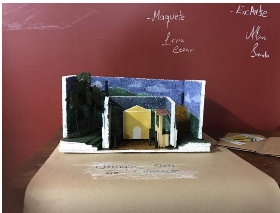
Figura 3. Trabalho da estudante da Arquitetura

experiência da travessia: “Da paisagem ao lugar André do Mato Dentro e seus arredores”.