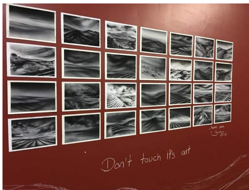
Figura 2. Trabalho da estudante das Belas Artes

cercam desde à Serra do Curral até às memórias do sul”. A estudante, ao apresentar a paisagem, mostrou pelo seu olhar a importância da angulação que mostra, “como se estivesse em cima da Serra justamente como estava na travessia”. Além disso, a diversidade e o modo como que trata a vegetação e a profundidade da paisagem, dos horizontes mostra a particularidade de quem vê e apresenta essas paisagens (figura 2).