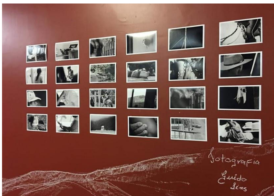
Figura 4. Trabalho do estudante da Geografia