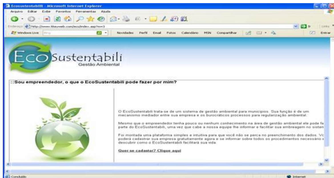
Figura 1: Tela da Ferramenta Computacional “ EcoSustentabili ,” apresenta a logomarca do site e uma breve introdução do objetivo da mesma.

Na tela inicial da Ferramenta Computacional (Figura 1) mostra-se a logomarca do sítio e faz uma breve introdução do conteúdo e objetivo da Ferramenta.