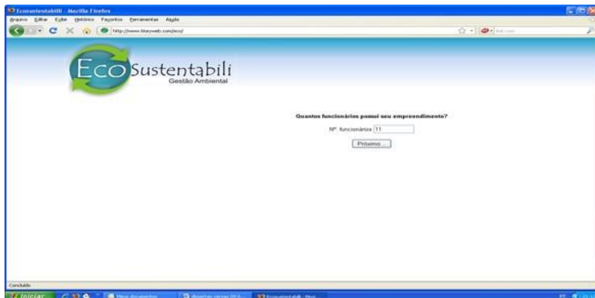
Figura 8: Tela da Ferramenta Computacional “EcoSustentabili” com o campo informando o número de funcionários do empreendimento.

Para definir o índice de cada fator (ar, água e solo) somar-se-ão os índices de cada atividade desenvolvida pelo empreendimento, o valor é convertido em porcentagem e atribuído seu valor de 1 a 3 (1 pequeno, 2 médio e 3 grande), seguindo as seguintes convenções: