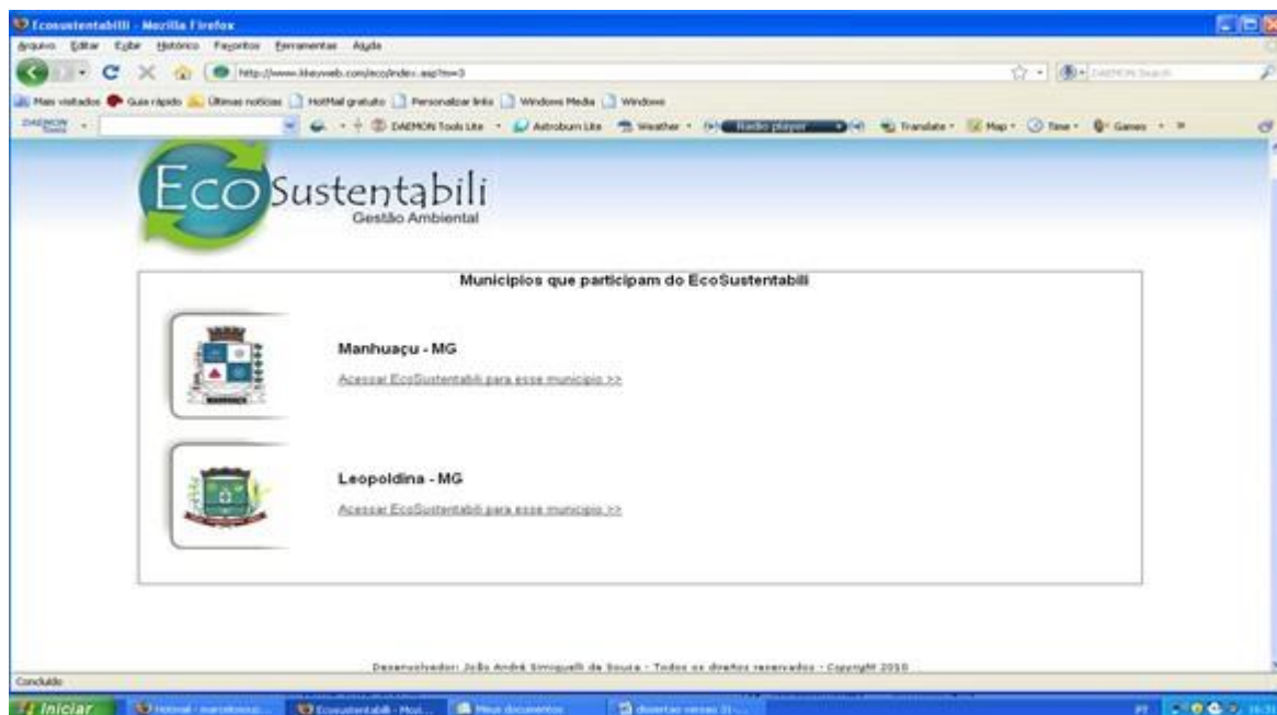
Figura 10: Tela da Ferramenta Computacional “EcoSustentabili” onde estão apresentados os brasões dos municípios selecionados neste estudo.

Finalmente, a Ferramenta Computacional “EcoSustentabili” mostra os brasões dos municípios que participaram deste estudo (Figura 10).