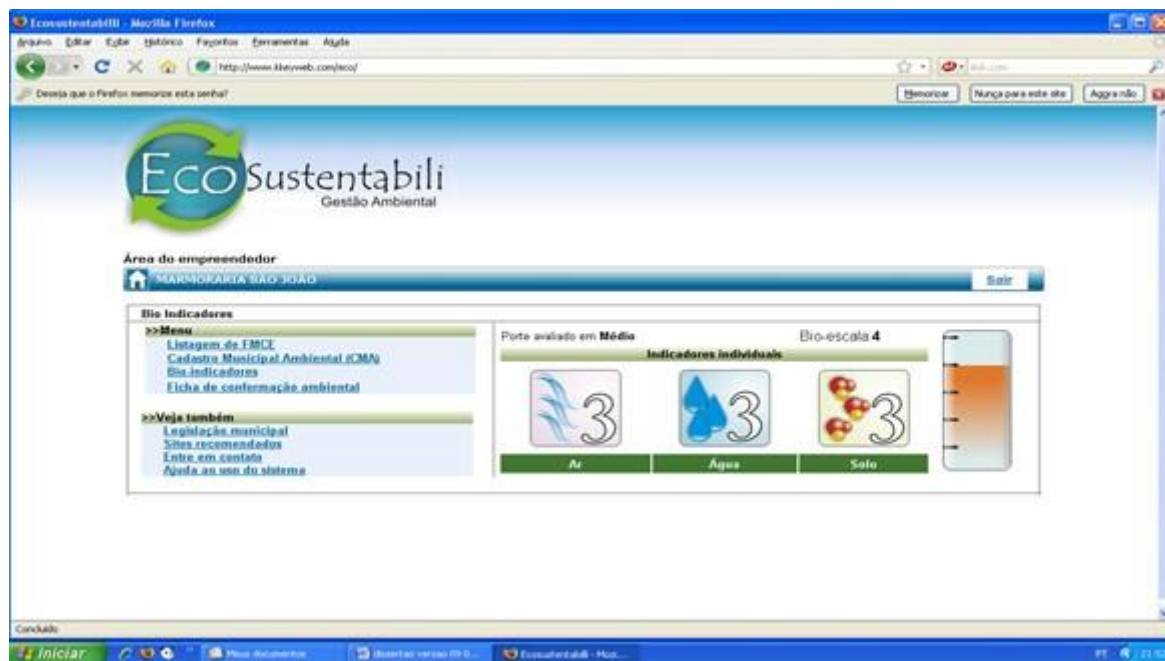
Figura 9: Tela da Ferramenta Computacional “EcoSustentabili” mostrando a bioescala de acordo com o porte do empreendimento.

Finalmente, a Ferramenta Computacional “EcoSustentabili” mostra os brasões dos municípios que participaram deste estudo (Figura 10).