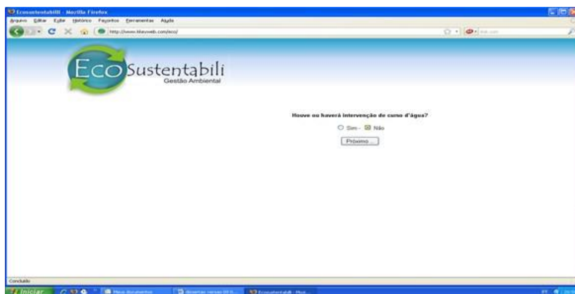
Figura 5: Tela da Ferramenta Computacional “EcoSustentabili” com o campo informando se houve ou haverá intervenção no curso d’água.

A tela seguinte pergunta se para a instalação do empreendimento houve ou haverá intervenção no curso d’água. Em caso afirmativo, a Ferramenta Computacional automaticamente determinará os requisitos obrigatórios (Figura 5).