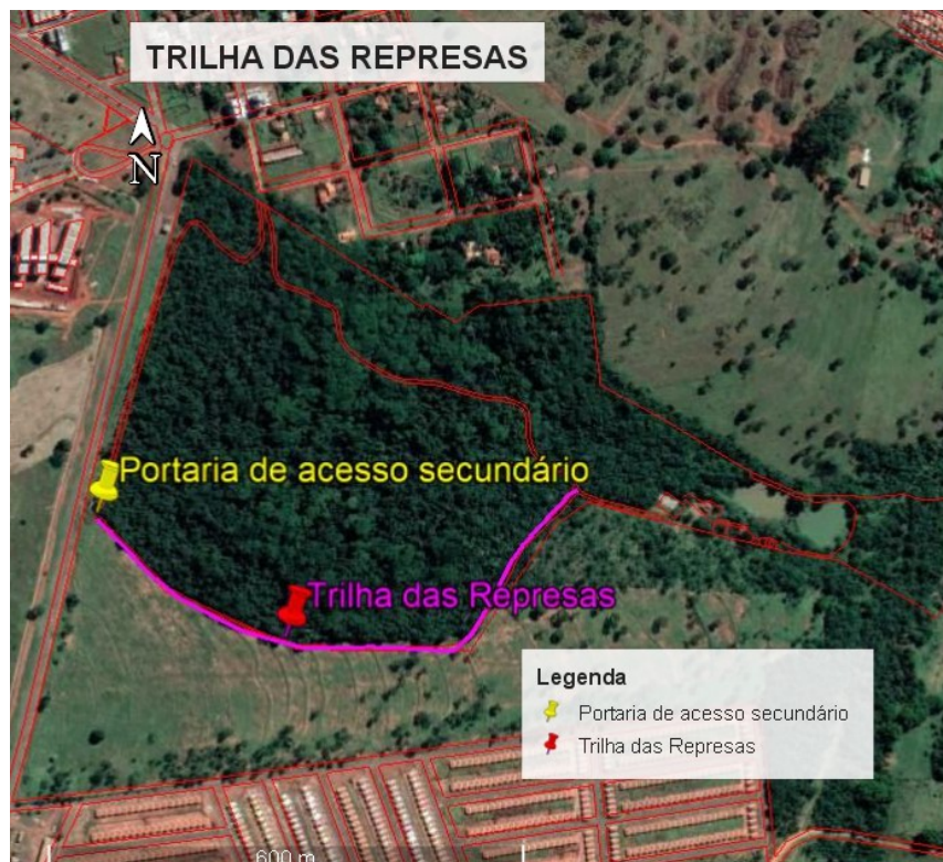
Figura 03. Localização e extensão da Trilha das Represas.

A trilha Secundária ou das “represas” (figura 3) tem uma extensão de aproximadamente 776 metros, onde também é possível trabalhar a IA através de PI demonstrando aspectos da hidrografia, identificando o canal principal do parque, a extensão, os afluentes, canais de escoamento, bem como identificar as nascentes.