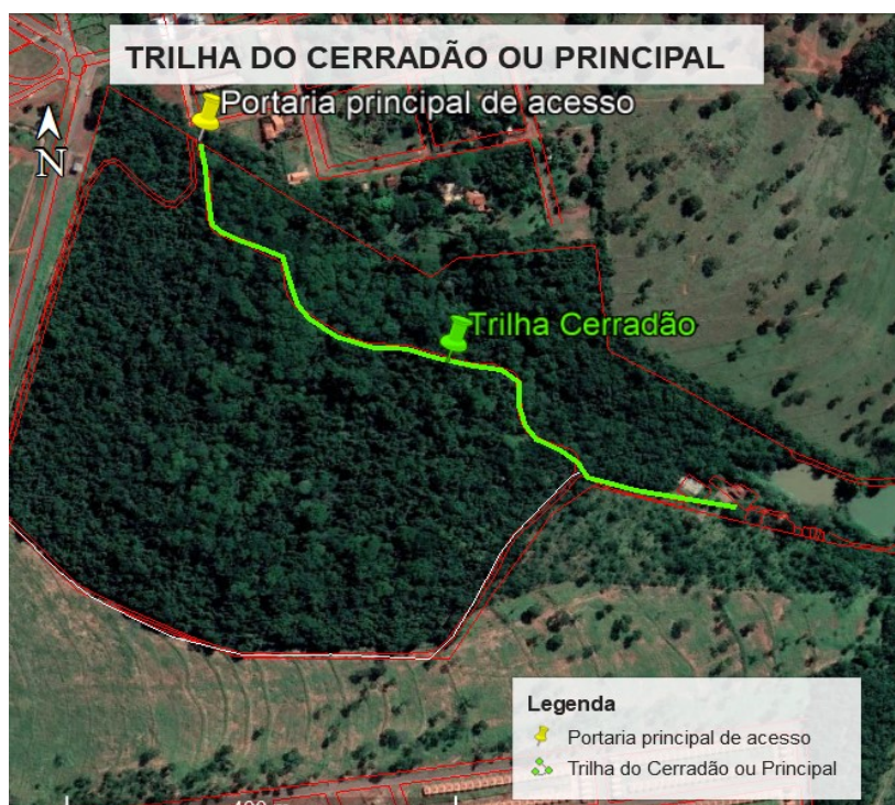
Figura 02. Localização e extensão da trilha do Cerradão

Na trilha principal, denominada de “Cerradão” (figura 2), com aproximadamente 831 metros de extensão, é considerada uma trilha de fácil acesso devido a sua largura de aproximadamente 2 metros.