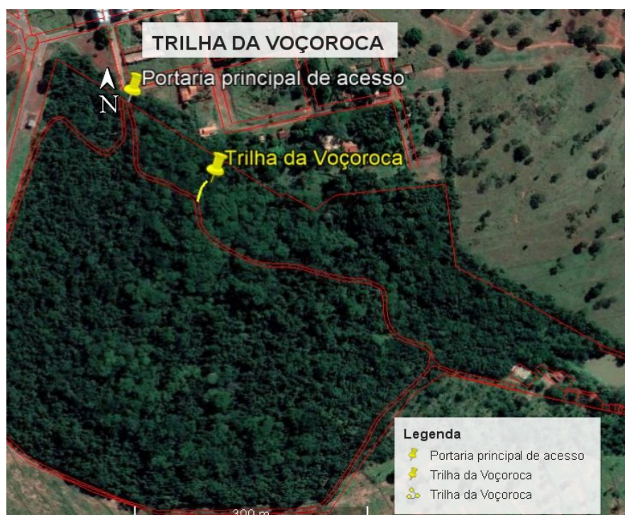
Figura 05. Localização e extensão da Trilha da Voçoroca.

A trilha “Voçoroca (figura 5), é a menor, tendo uma extensão de aproximadamente 27 metros, iniciando-se na Trilha Cerradão, com pouca inclinação, podendo se trabalhar a IA através das rochas existentes no local, com destaque para a Formação Adamantina e os solos oriundos dela sendo um dos tipos os Argissolos.