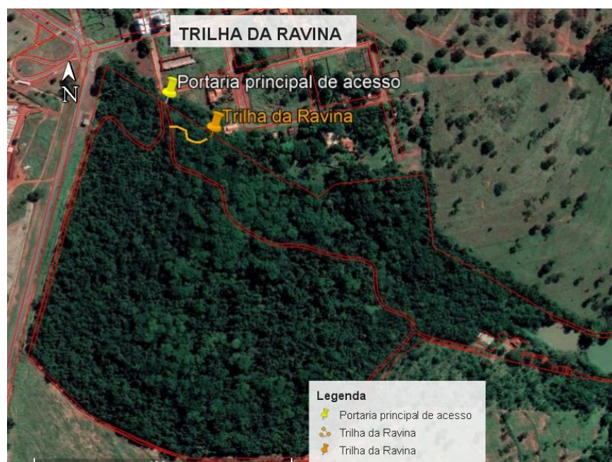
Figura 04. Localização e extensão da Trilha da Ravina

A trilha “Voçoroca (figura 5), é a menor, tendo uma extensão de aproximadamente 27 metros, iniciando-se na Trilha Cerradão, com pouca inclinação, podendo se trabalhar a IA através das rochas existentes no local, com destaque para a Formação Adamantina e os solos oriundos dela sendo um dos tipos os Argissolos.