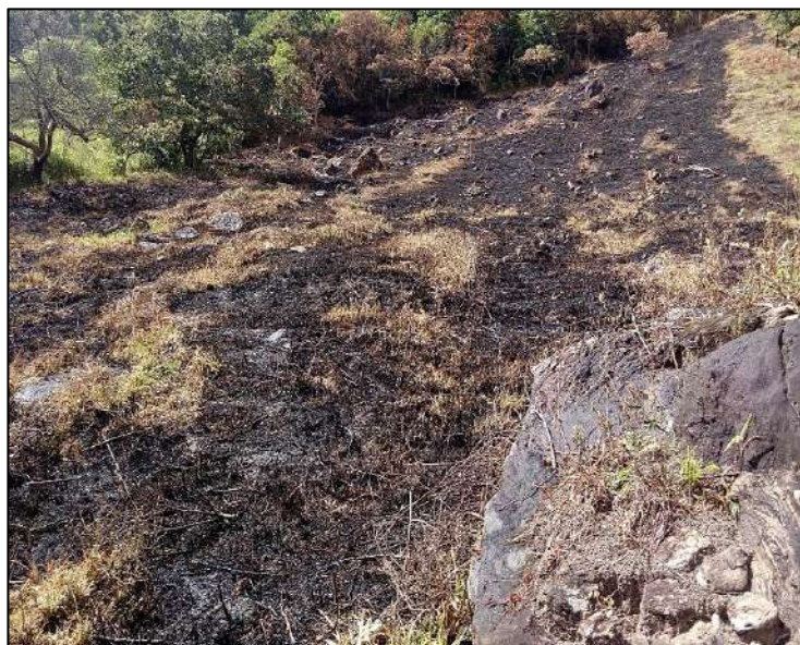
Figura 4: Queimada no sítio Ribeirão Grande.

O desmatamento, queimadas, pecuária e o uso excessivo de fertilizantes químicos para a agricultura também foram fatores fundamentais na formação desses impactos no solo, que vem crescendo cada vez mais na propriedade estudada, e são uma das principais causas da degradação dos solos deste local. A figura 6 ilustra de forma nítida uma área desmatada por meio das queimadas, onde grande parte dos agricultores praticam a limpeza do solo principalmente nas épocas secas o que acaba intensificando ainda mais a degradação do solo.