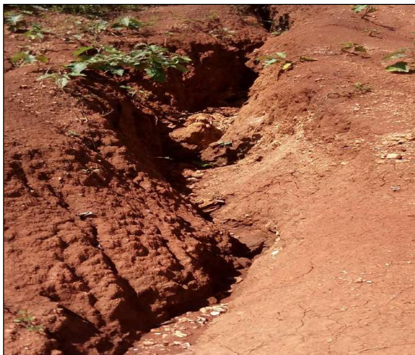
Figura 3: Surgimento de Voçoroca no sítio Ribeiro Grande.