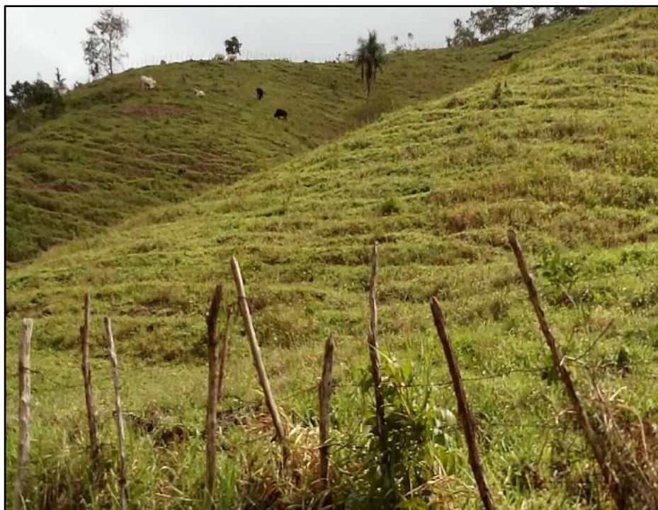
Figura 1: Cercado de gado no sítio Ribeiro Grande.