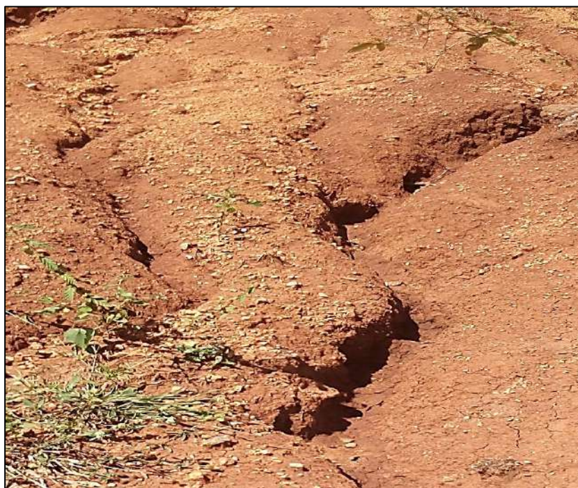
Figura 2: Surgimento de ravinas no Sítio Ribeiro Grande.