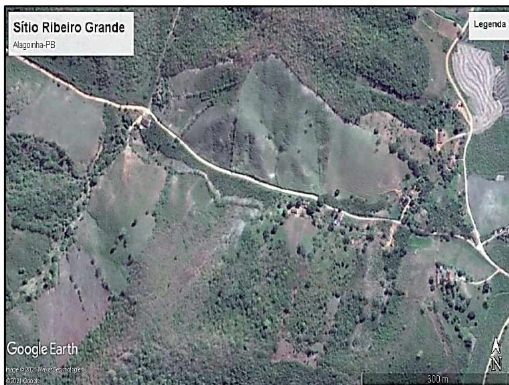
Mapa 1: Localização do Sítio Ribeiro Grande no município de Alagoinha-PB.

O sítio Ribeiro Grande se localiza no município de Alagoinha-PB próximo as encostas do planalto da Borborema, com uma área de aproximadamente 12km 2 segundo dados obtidos da prefeitura da cidade de Alagoinha sendo que uma parte está muito degradada por meio da ação antrópica, no qual nos últimos anos vem sofrendo com um processo de erosão. Os meses mais chuvosos na área de estudo é de abril a agosto, porem se percebe que é nessas áreas que a erosão pluvial é mais dinâmica, sendo também um relevo muito íngreme contribui com esse processo.