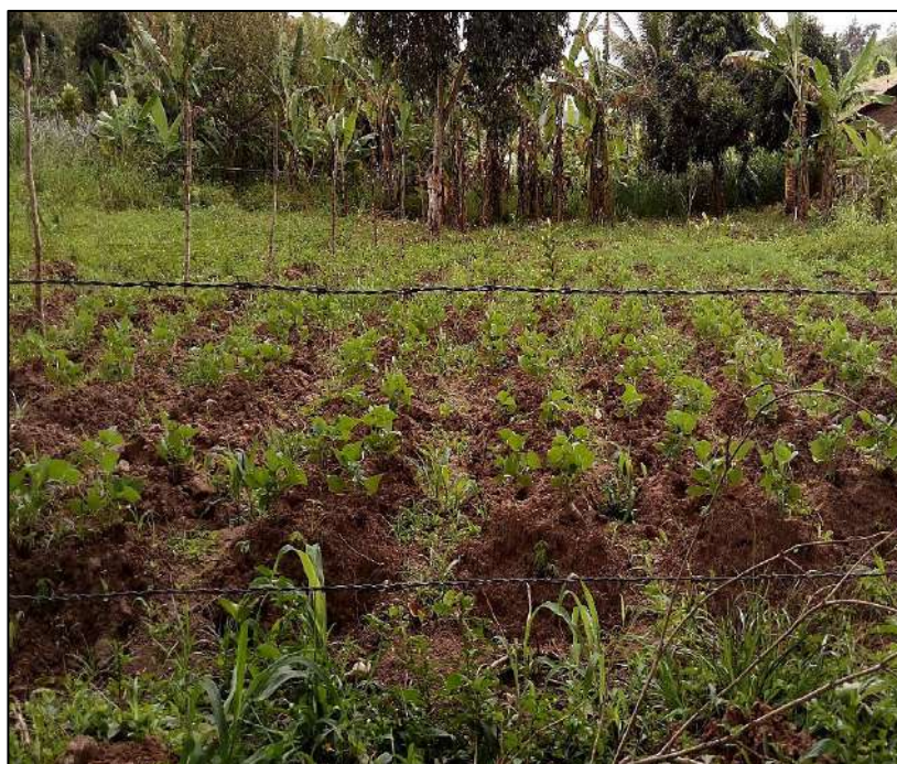
Figura 5: Plantio agrícola no sítio Ribeiro Grande.

Podemos perceber que o Sítio Ribeiro Grande ainda continua cultivando o solo para a plantação de algumas atividades agrícolas que vem se destacando no município de Alagoinha-PB. Na figura 7 abaixo vemos uma plantação de agricultura familiar.