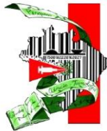
Figura 2: Centro de Formação Quilombola por Alternância Raimundo Sousa