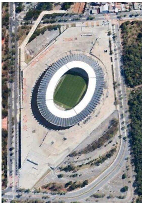
Figura 2 – Estádio Mineirão após a reforma – Abril de 2014