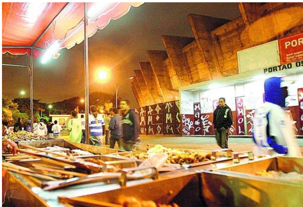
Figura 3 – Barraca em frente ao Portão 9 do Estádio Mineirão anteriormente a reforma

socioespaciais são utilizadas enquanto justificativas para transformar a capital mineira em uma capital turística, transformando a paisagem em uma paisagem turística estandardizada.