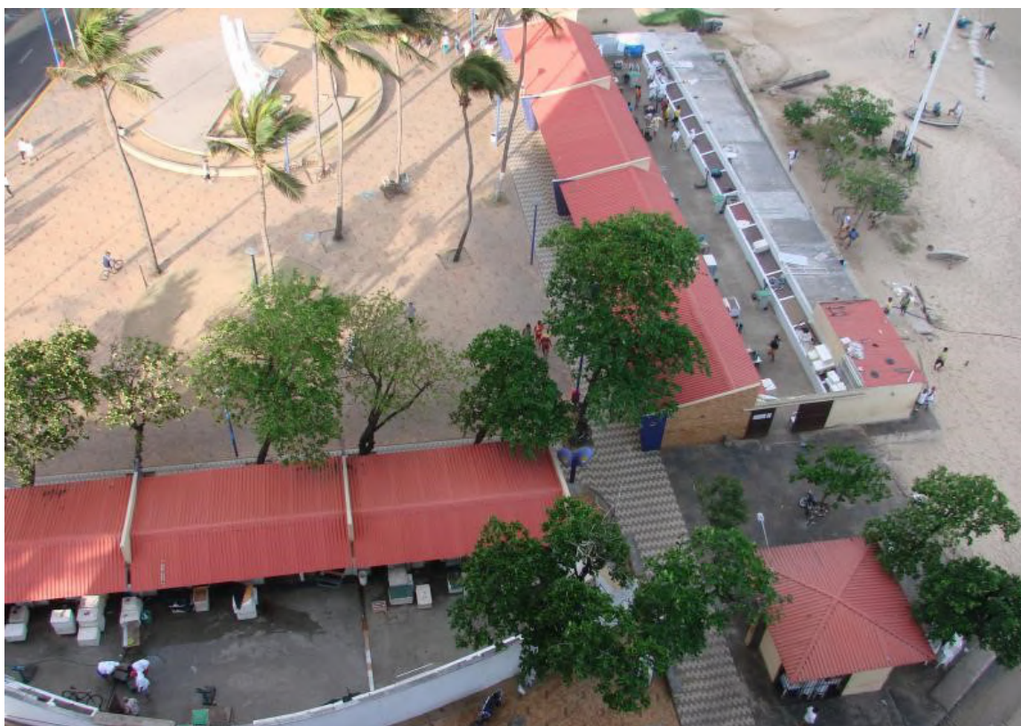
Figura 04: Praça dos Pescadores e Mercado dos Peixes do Mucuripe, 2013.

Por outro lado, ainda nos anos 1960, foram criadas a Praça dos Pescadores e o Mercado dos Peixes do Mucuripe (GARCIA, 2010). O projeto do Mercado tinha como principal objetivo estruturar a feira de peixes ali existente, onde ocorria a venda diretamente nas jangadas ou em barraquinhas de madeira e palha. O partido arquitetônico buscava uma aproximação com a tradição da pesca de jangada, numa tentativa de inclusão da comunidade. A estrutura do mercado contava com pequenos boxes distribuídos em “L”, sendo integrada à Praça dos Pescadores e ao ancoradouro das jangadas. Ao longo das décadas a edificação recebeu algumas reformas para manutenção e adaptações no desenho dos boxes até sua conformação mais recente (Figura 04), tornando-se, a partir da década de 1990, um dos principais pontos de referência da cultura alimentar local na orla de Fortaleza.