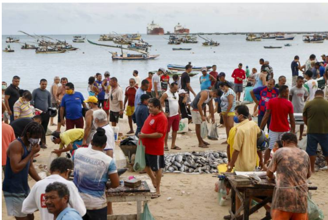
Figura 06: Comércio informal de peixes na praia do Mucuripe, 2020.