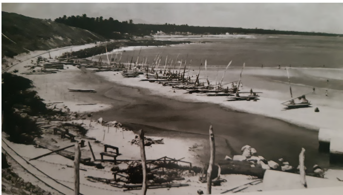
Figura 03: Linha do ramal ferroviário Parangaba-Mucuripe, e ancoragem de jangadas Fonte: Arquivo Nirez Apud : GARCIA, 2010.

O interesse na região foi retomado duas décadas depois, quando em 1891 foi aberto o ramal ferroviário Parangaba-Mucuripe (Figura 03), primeiro passo para retomada do projeto do porto, que serviria para escoamento da produção agrícola, principalmente a algodoeira do Ceará para o comércio exterior (NOBRE, 2011).