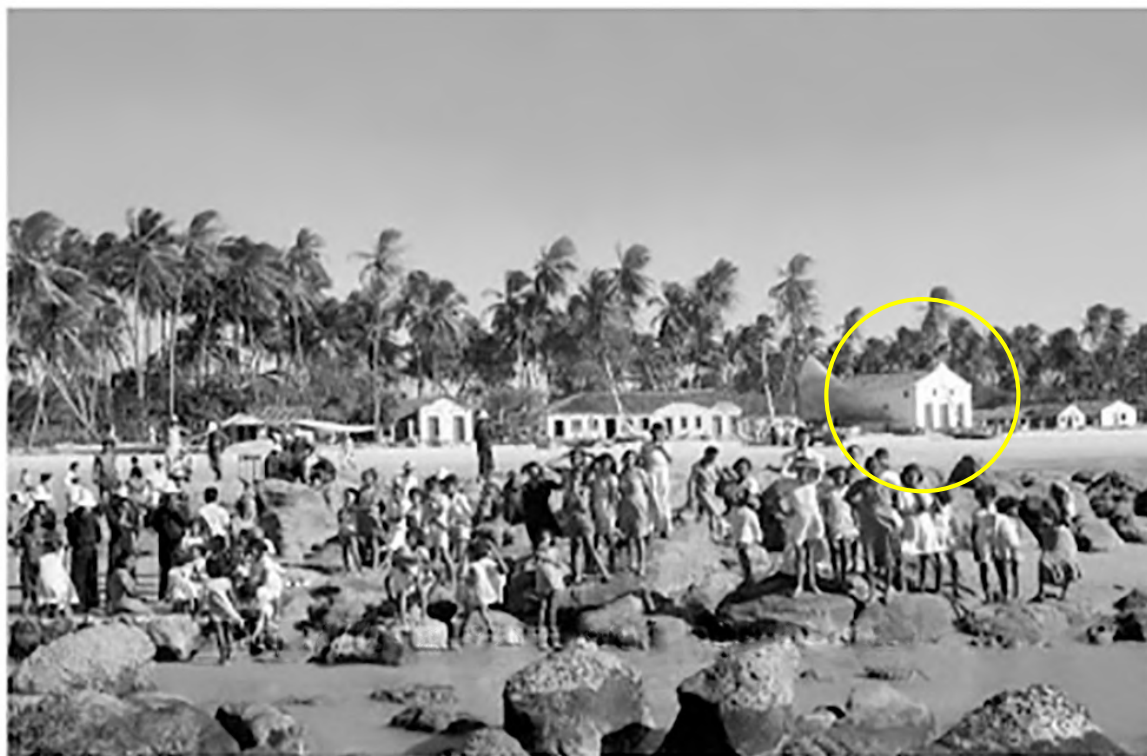
Figura 02: Registro de membros da comunidade jangadeira da praia do Mucuripe, 1942. (Ao fundo, a Capela de São Pedro dos Pescadores)

Essa comunidade se dividia em dois pequenos centros habitacionais, à margem esquerda e à margem direita do riacho. Na margem direita se instalou em 1852 o símbolo da fé e primeiro templo religioso da comunidade: a Igrejinha de Nossa Senhora da Saúde, posteriormente Capela de São Pedro dos Pescadores (SECULT, 2017). Despontando entre as casas de palha que abrigavam as famílias de pescadores, foi por muitas décadas a única instituição existente na comunidade (Figura 02).