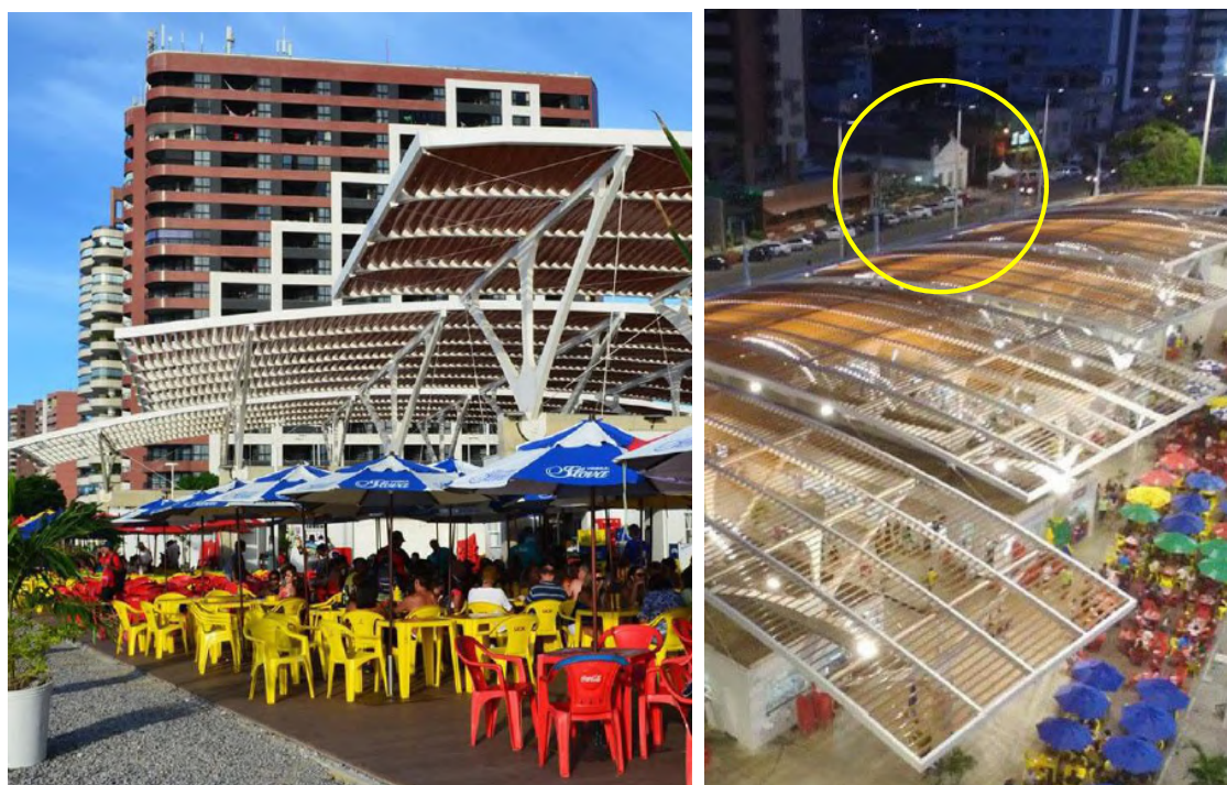
Figura 05: Mercado dos Peixes do Mucuripe e Capela de São Pedro (detalhe), 2016.

que se trata de uma área extremamente urbanizada e cosmopolita da capital cearense” (MARQUEZ, 2016). O resultado foi uma edificação com boxes implantados de forma a se buscar proveito da ventilação natural, com destaque para a cobertura em estrutura metálica e brises de alumínio buscando amenizar a insolação, e da paginação de piso que mescla concreto (nas áreas de venda), madeira ecológica (na área de deck), além de piso cerâmico branco para atender as exigências sanitárias (Figura 05).