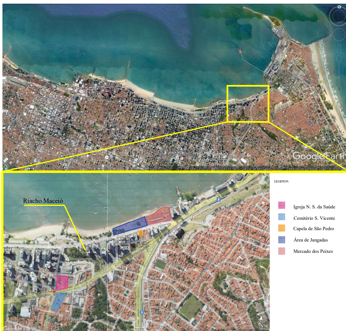
Figura 01: Mercado dos Peixes do Mucuripe – Localização, 2021.

Localizada em Fortaleza, Ceará, a praia do Mucuripe compreende uma faixa de orla de aproximadamente 1,2 km. Considerado um dos “cartões postais” da capital cearense, é uma área conhecida tanto pelo potencial paisagístico quanto econômico (turístico e imobiliário). Conta com importantes elementos históricos e culturais, e abriga uma tradicional comunidade jangadeira (Figura 01).