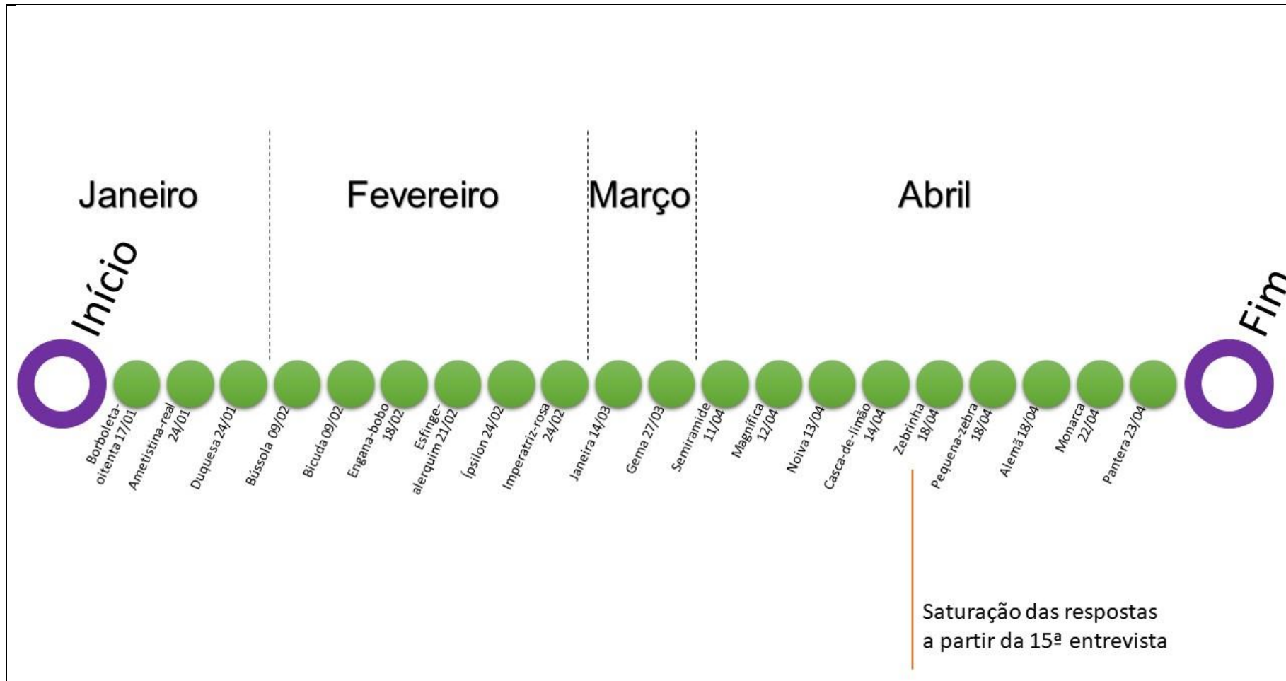
FIGURA 3 – CRONOGRAMA DAS ENTREVISTAS REALIZADAS COM TRAVESTIS E MULHERES TRANSEXUAIS, EM CURITIBA E PONTA GROSSA, PARANÁ, ENTRE 17 DE JANEIRO DE 2017 A 23 DE ABRIL DE 2017.

FONTE: As entrevistadas. Elaborado por Ramon O. B. Braga (2020).