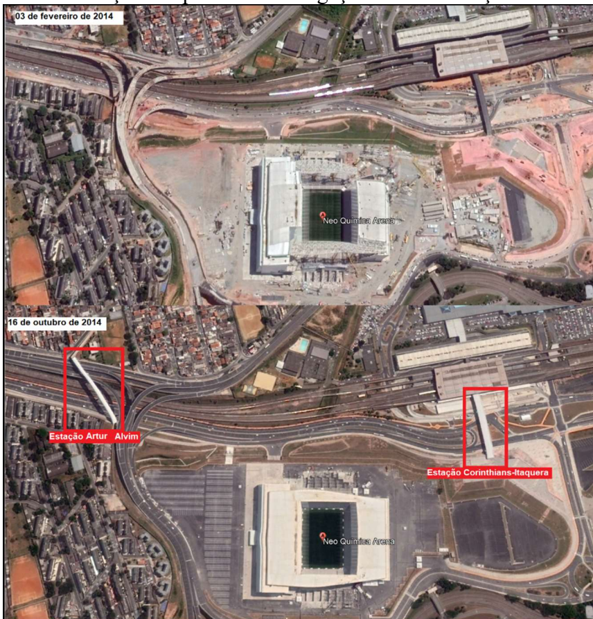
Figura 2: Construção das passarelas de ligação entre as estações de metrô e o estádio

Fonte: Google Earth, 2014. Org.: da autora.