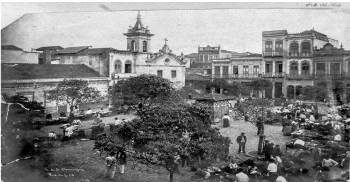
Imagem 2 – O Largo de São Domingos

Fonte: Largo de São Domingos. Augusto Malta, 1913. Coleção Augusto Malta. Museu da Imagem e do Som – RJ. Apud - PAMPLONA, Patrícia. Lugares de Memória dos Trabalhadores#53: Igreja e Largo de São Domingos de Gusmão, Rio de Janeiro.(online).2020.Disponívem em: https://lehmt.org/lugares-de-memoria-dos-trabalhadores-53-igreja-e-largo-de-sao-domingos-de-gusmao-rio-de-janeiro-rj-patricia-pamplona/ Acesso.20/11/2023