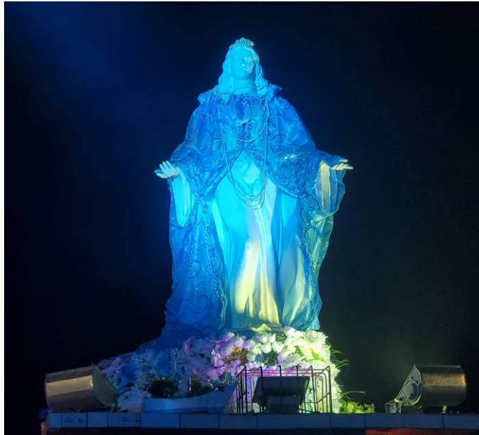
Figura 3- Estátua de Iemanjá na Praia do Cassino (RS) durante a noite

Já na Figura 3, a estátua é iluminada pelos holofotes durante a primeira noite da celebração, o principal momento de encontro na estátua para realização de entregas e rituais ao redor do monumento e na beira da praia.