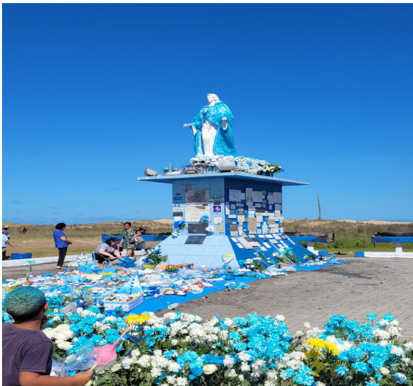
Figura 2 - Estátua de Iemanjá com diversas oferendas ao redor

Dessa forma, os santuários são considerados centros de atração dos fiéis, além de também serem destinos de peregrinações (SANTOS, 2013). Para os entrevistados, a estátua de Iemanjá é mais do que um símbolo religioso e materialização do sagrado, mas também um espaço de representação e resistência política de um lugar de culto que sempre foi marginalizado no território brasileiro. Desse modo, os símbolos que materializam o culto exibem o poder da instituição, além de comunicar a mensagem que une e identifica os devotos daquele grupo cultural (CORRÊA, R. 2013). A Figura 2 mostra o espaço da estátua de Iemanjá com diversas oferendas ao redor, incluindo alimentos, bebidas alcoólicas e principalmente flores nas cores branca e azul.