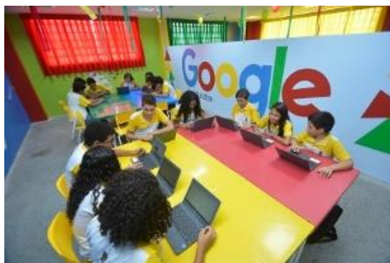
Figura 01. Laboratório do Google for Education em Sobral.

Com este currículo a educação de Sobral busca fomentar a formação inicial de seus moradores, incluindo nos anos iniciais conhecimentos das áreas de engenharia, tecnologia e computação como tópicos curriculares obrigatórios. Além disso, o currículo aborda o uso da tecnologia como ferramenta de investigação e construção, e não somente como uma mídia eletrônica, como mostra o currículo. A educação de Sobral tem respirado em novos ares com a imersão em laboratórios da FabLearn/TLTL e da Google for Education em escolas pilotos, com ferramentas tecnológicas para a formação dos alunos, como é possível observar na figura 01.