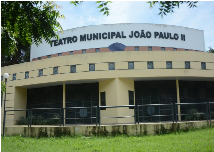
Figura 3 - Teatro João Paulo II

aniversário de 153 anos de Teresina, com apresentações de vários espetáculos de teatro, música e dança.