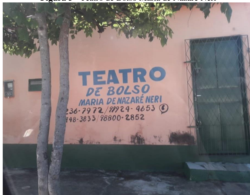
Figura 5 - Teatro de Bolso Maria de Nazaré Neri

Na região do Itararé temos ainda o Teatro de Bolso "Maria de Nazaré Neri", (fig. 5) que surgiu com o intuito de levar atividades artísticas a comunidade do bairro Extrema e comunidades vizinhas que não tem tempo e nem dispõem das condições para frequentarem os grandes espaço culturais no centro da cidade, e também participar das grandes atividades culturais, como: Teatro, música, danças, por meio das oficinas oferecida que acontecem nestes espaço.