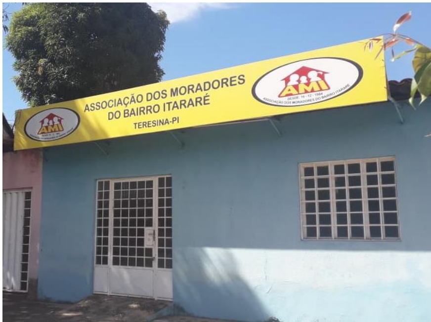
Figura 6 - Associação de Moradores do Itararé (AMI)

artistas e dos moradores, como a biblioteca pública Estação Nova da cultura, que serve de apoio aos estudantes e artistas da região na formação cultural e na contribuição para a educação e a Associação de Moradores do Itararé (AMI) (fig. 6), que sempre esteve presente junto aos moradores e artistas na luta por melhores condições para o bairro. A biblioteca é mantida pelo poder público estadual, e conta com um auditório amplo e arejado que serve de espaço para realização de eventos culturais, palestras e ensaios de grupos de danças e teatros da comunidade.