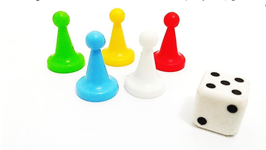
Figura 2: Pinos coloridos e dado utilizados na aplicação do jogo.