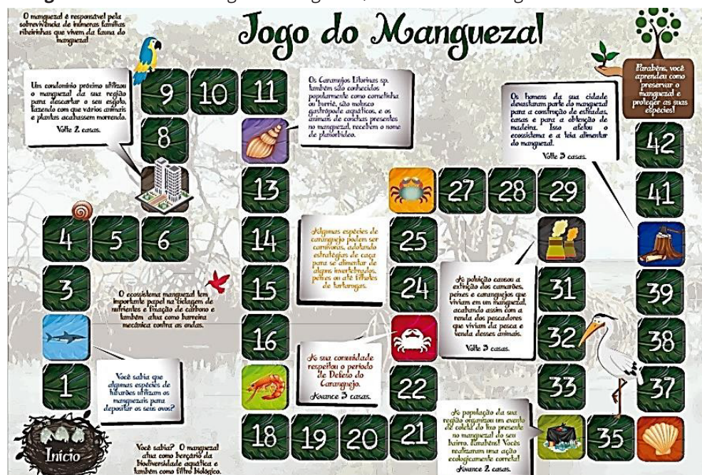
Figura 3: Tabuleiro do Jogo do Manguezal, mostrando as imagens da fauna e flora.

O tabuleiro foi desenhado utilizando a imagem de um manguezal ao fundo, na qual, são visíveis as raízes do tipo escora e algumas rizóforas ( Rhizophora mangle ), para que os alunos reconheçam as particularidades da flora do manguezal. Posteriormente, foi elaborado o percurso do jogo, que é composto por 42 casas, contendo ilustrações de ações antrópicas, e ações benéficas para o manguezal, e também a figura dos seguintes animais: um caranguejo, um camarão, um bivalve, um gastrópode e também um tubarão. Abaixo segue uma imagem do tabuleiro do jogo.