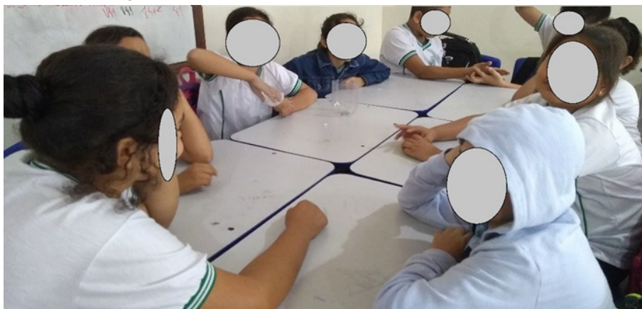
Figura 1: Grupo de alunos reunidos para a construção

Para construir o filtro os alunos cortaram a garrafa pet a 20 cm de seu gargalo para que os materiais pudessem ser colocados em seu interior, e foram respectivamente colocados um chumaço de algodão, uma camada de carvão em pó, areia de aquário e as pedras pequenas. A parte que foi retirada da garrafa serviu como um pequeno reservatório da água que foi filtrada ficasse armazenada.