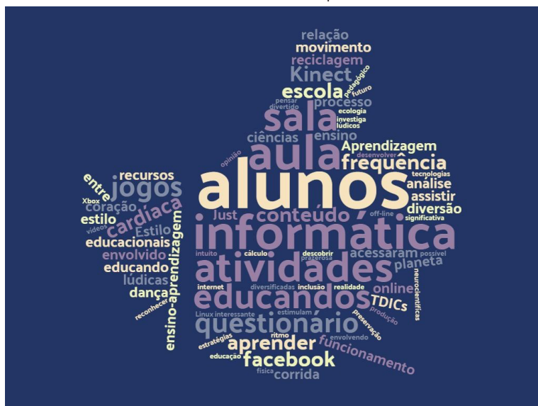
Gráfico 2- Nuvem de palavras