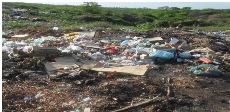
Figura 03- Depósito inadequado de resto de animais