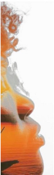
Imagem 3 - Árvore da Ancestralidade

Apresentada a representação de uma “Árvore Genealógica”, as e os estudantes devem reproduzir em uma folha de caderno ou uma folha de ofício a sua árvore a partir dos avós, sendo utilizados rostos para essa identificação. Assim, as e os estudantes devem recortar os biotipos que mais representam a fisionomia de seus familiares. Após essa montagem, a tarefa é pintar com os recursos disponíveis (os gizes disponibilizados e os próprios lápis de cor). O processo de montagem da árvore, da escolha dos rostos e das cores a serem utilizadas, gera bastante engajamento dos estudantes. A atividade é possível ser realizada em uma aula de 50 minutos e funcionou como uma síntese visual de uma apresentação prévia do conteúdo, tendo sido aplicada em turmas de 7º ano.