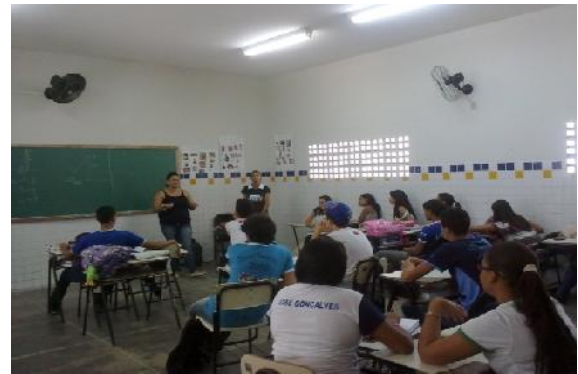
Foto 2 - Exibição do filme Tempos Modernos de Charles Chaplin, com a turma de 3º ano da Escola José G. de Queiroz, em 2012.