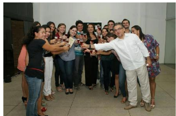
Foto 4 - Autores e coautores no lançamento do Livro Pibid: Memórias de iniciação à docência, publicado no ano de 2013.