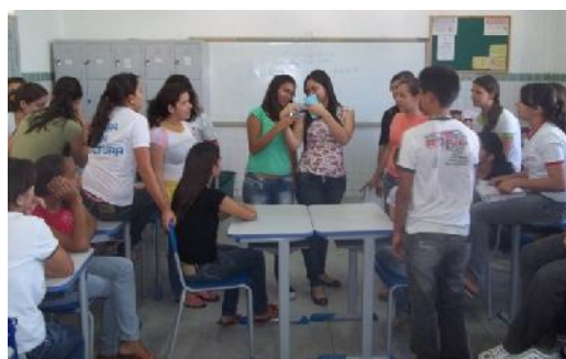
Figura 2: Aplicação do Jogo das três pistas.

A equipe ganha a pontuação de acordo com a ordem que acerta a resposta. Caso o aluno que tem a oportunidade da última pista não acerte ou não souber a resposta o seu oponente também terá a chance de responder e se este também não souber ninguém pontua. Por fim, a equipe que obtiver maior pontuação ao final do jogo será a vencedora.