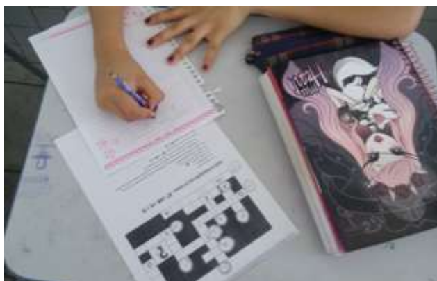
Figura 04: Aluno realizando a atividade da Cruzada

Numa leitura prévia a Teoria da Situações Didáticas conforme Brousseau (2008), ele indica que no desenvolvimento didático de uma atividade o professor, o aluno e o saber matemático assumem posições específicas e estas são regidas por um conjunto de regras implícitas chamadas Contrato Didático. Como assumimos inicialmente uma postura de trabalhar com o lúdico, os alunos receberam a atividade com entusiasmo.