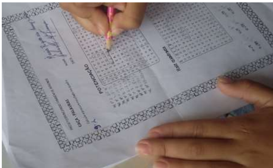
Figura - 01 Aluno resolvendo o Caça-palavras de Sondagem

mencionados, como radiciação, potenciações, equações do 1º grau dentre outros.