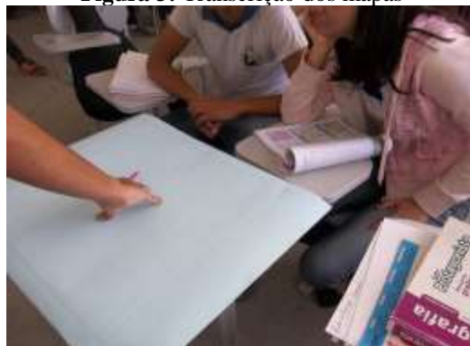
Figura 3: Transcrição dos mapas