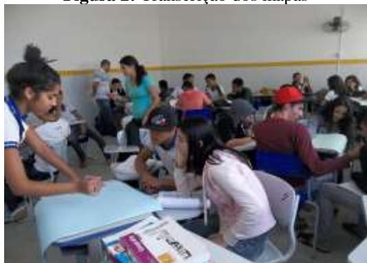
Figura 2: Transcrição dos mapas