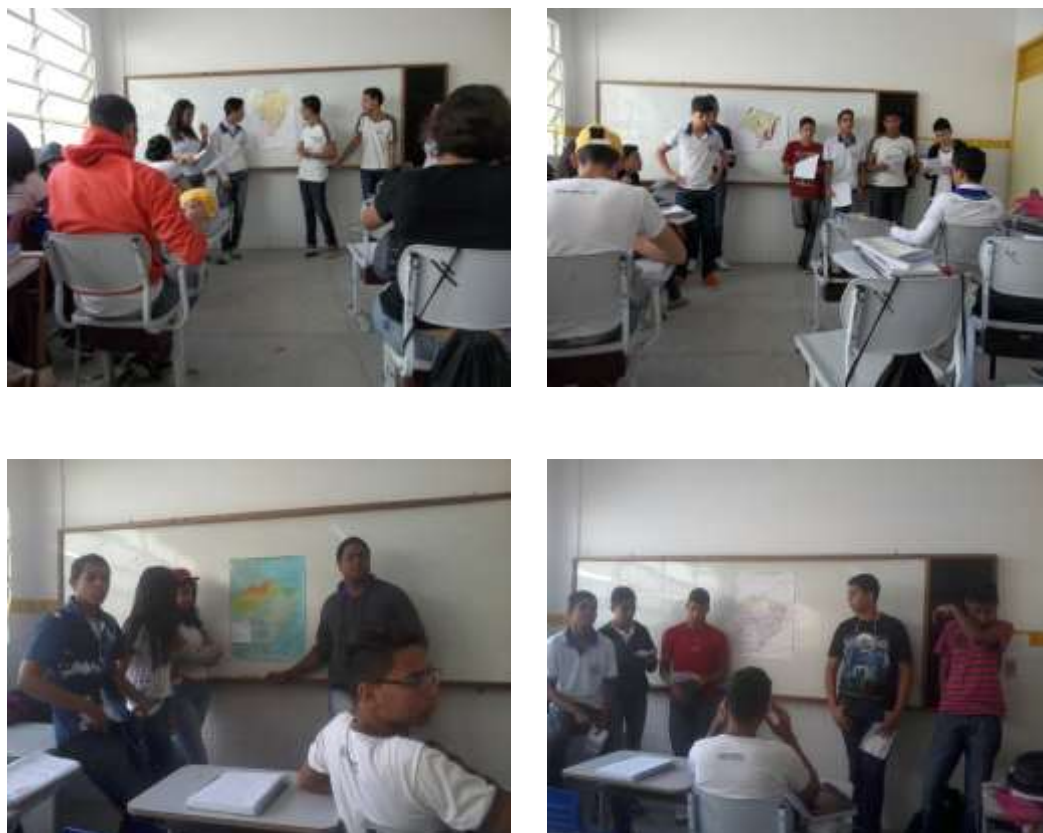
Figura 5: Apresentação do material produzido no projeto de intervenção.