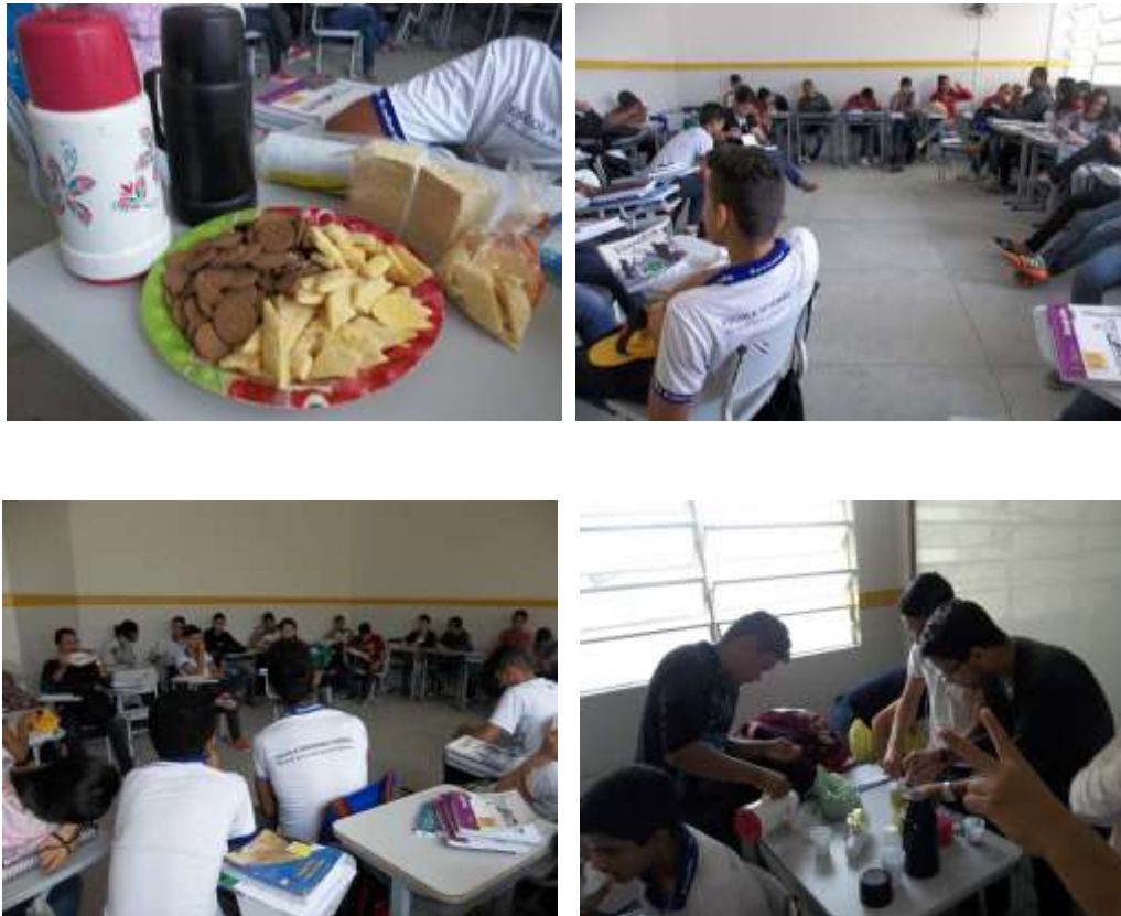
Figura 6: Realização do Café Geográfico no âmbito das atividades do projeto.