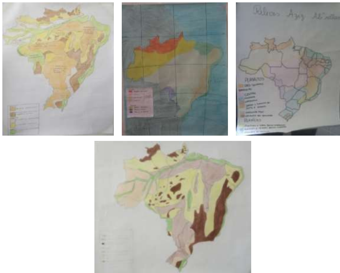
Figura 4: Mapas desenhados pelos alunos