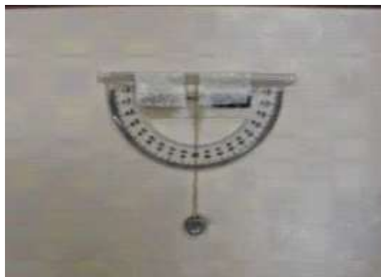
Figura 1. Teodolito artesanal.