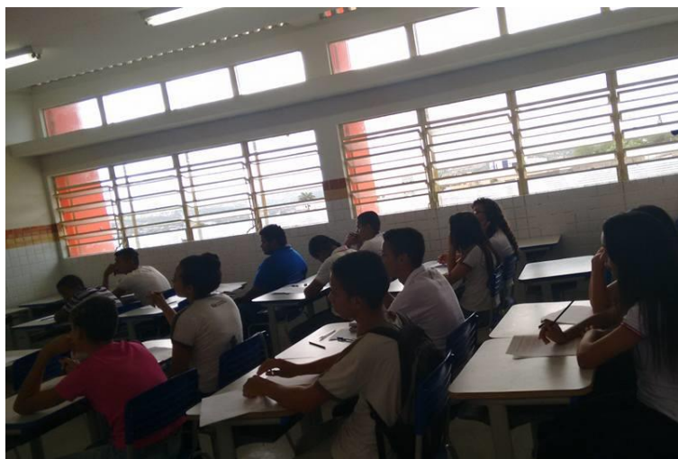
Figura 1: Alunos atentos à explicação na aula de revisão.

Primeira etapa: No primeiro momento da aplicação deste projeto os alunos participantes foram direcionados a um questionário diagnóstico dos conhecimentos prévios que eles tinham sobre as novas regras apontadas na Reforma da Previdência. Neste mesmo momento, dividimos nossa equipe de modo que cada um ficasse responsável por explicar cada assunto abordado na oficina, relacionando conteúdos do nosso cotidiano. Contamos com auxílio de uma apostila, onde elaboramos questões de conjuntos envolvendo resoluções de problemas do livro de Dante 2016, que foram contextualizadas com a temática da Reforma da Previdência Social para situá-los no tema da oficina através do uso de conteúdos envolvidos nas técnicas de cálculo dos elementos componentes das novas regras propostas pela reforma.