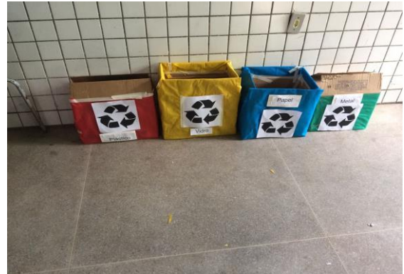
Foto 6: Coletores confeccionados pelos alunos, 4º ano. EEEF Desemb. Pedro Bandeira em 02/10/2017.

EEEF Desemb. Pedro Bandeira em 02/10/2017.