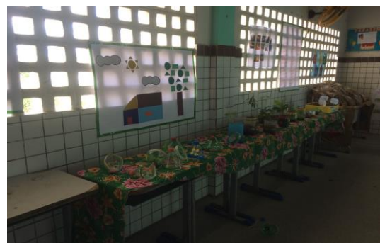
Foto 16: Sala de exposição. 2º,3º,4º e 5º ano. EEEF Desemb. Pedro Bandeira em 21/21/2017.