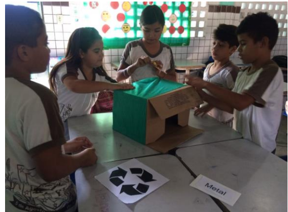
Foto 8: Alunos confeccionando coletores, 4º ano. EEEF Desemb. Pedro Bandeira em 02/10/2017.