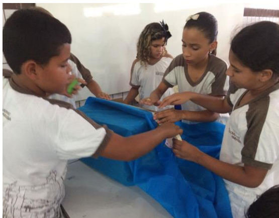
Foto 7: Alunos confeccionando coletores, 4º ano. EEEF Desemb. Pedro Bandeira em 02/10/2017. Foto: Jéssica Santana

EEEF Desemb. Pedro Bandeira em 02/10/2017. Foto: Jéssica Santana.