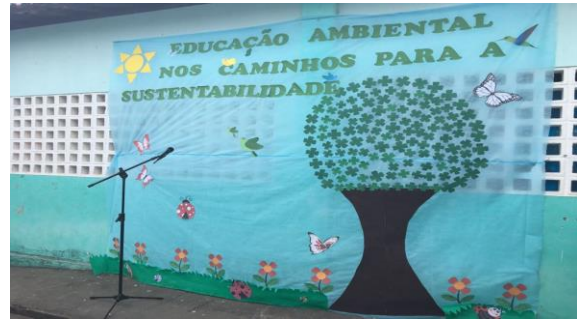
Foto 18: Painel central. EEEF Desemb. Pedro Bandeira em 21/21/2017.

Como é possível visualizar acima (nas fotos de 1 a 18), durante a execução do Projeto sobre Educação Ambiental foram realizadas atividades diversas, que envolviam alunos, bolsistas e professores da escola onde o PIBID/Subprojeto de Pedagogia atuou, tais como: com oficinas diversas, exibição de vídeos, jogos, brincadeiras, etc. No dia do encerramento das atividades foi realizada uma exposição dos trabalhos feitos pelos alunos e uma culminância com atividades culturais apresentadas por alunos e professores da escola.