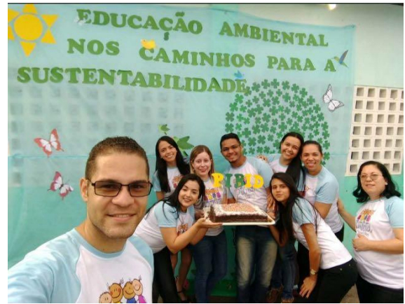
Foto 12: Homenagem para os Bolsistas PIBID. EEEF Desemb. Pedro Bandeira em 21/21/2017.