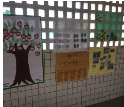
Foto 14: Exposições dos cartazes. 2º,3º,4º e 5º ano. EEEF Desemb. Pedro Bandeira em 21/21/2017.