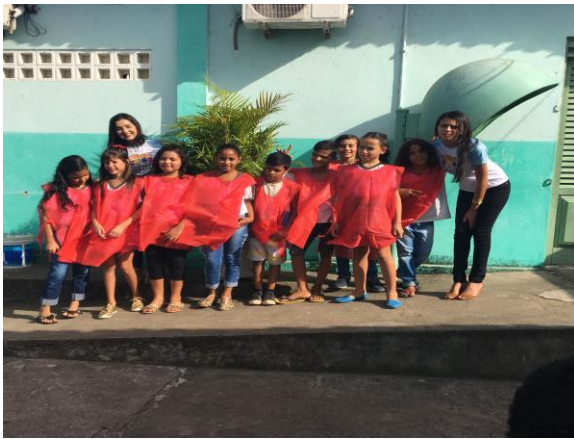
Foto 11: Apresentação coral, 3º ano. EEEF Desemb. Pedro Bandeira em 21/11/2017.