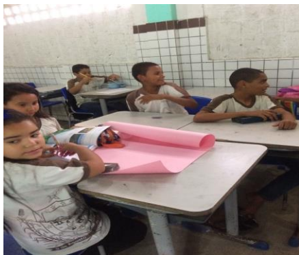
Foto 1: Alunos confeccionando cartazes, 4º ano. EEEF Desemb. Pedro Bandeira em 25/09/2017.

Isto foi trabalhado ao longo da execução do Projeto temático “Educação Ambiental nos caminhos para a sustentabilidade”. A seguir apresentamos fotos das atividades que foram desenvolvidas por alunos do 4º ano da EEEF Pedro Bandeira durante a execução do referido Projeto temático.