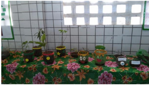
Foto 17: Horta sustentável. 2º, 3º, 4º e 5º ano. EEEF Desemb. Pedro Bandeira em 21/21/2017.