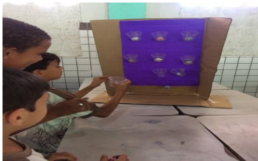
Foto 9: Alunos confeccionando brinquedos de reciclagem, 4º ano. EEEF Desemb. Pedro Bandeira em 03/10/2017.

Finalmente, a Educação Ambiental nas séries iniciais do ensino fundamental ajuda a consciência de preservação e de cidadania. A criança aprende, desde cedo, que precisa cuidar, preservar, pois a vida do planeta depende de pequenas ações individuais que fazem a diferença ao serem somadas, as pequenas atitudes, que “viram uma bola de neve” e proporcionam a transformação do meio em que mora. Vejamos as fotos a seguir relacionadas às atividades que foram desenvolvidas no segundo semestre de 2017 na EEEF Pedro Bandeira: