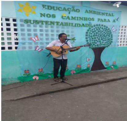
Foto 13: Apresentação do Professor Arthur. 5º ano. EEEF Desemb. Pedro Bandeira em 21/21/2017.