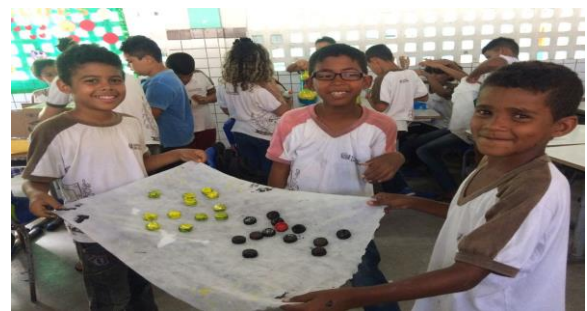
Foto 10: Alunos confeccionando brinquedos de reciclagem, 4º ano. EEEF Desemb. Pedro Bandeira em 03/10/2017.