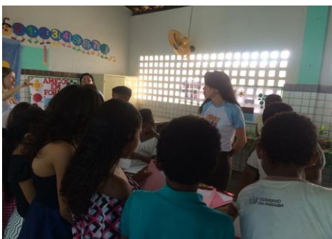
Foto 15: Alunos e bolsistas na sala de exposição. 4º ano. EEEF Desemb. Pedro Bandeira em 21/21/2017.