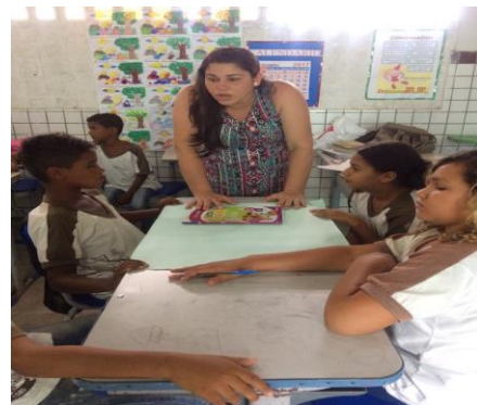
Foto 2: Alunos realizando a atividade do dia, 4º ano. EEEF Desemb. Pedro Bandeira em 25/09/2017.