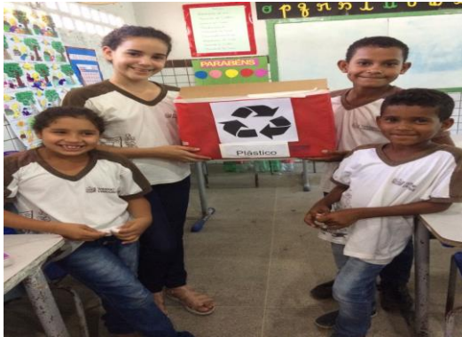
Foto 5: Alunos confeccionando coletores, 4º ano. EEEF Desemb. Pedro Bandeira em 02/10/2017.

EEEF Desemb. Pedro Bandeira em 25/09/2017.