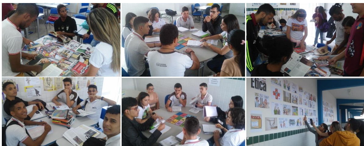
1. Trabalho de pesquisa realizado em sala de aula e biblioteca da escola

O primeiro passo para o sucesso das propostas lançadas pelo projeto, iniciado já no primeiro bimestre, teve como característica principal a pesquisa exploratória. Este momento foi dedicado à escolha tanto das temáticas e problemáticas, quanto dos autores e obras para o desenvolvimento das pesquisas. A Língua Portuguesa e a Matemática foram indispensáveis para o enriquecimento das propostas a serem realizadas e, conseqüentemente, um melhor rendimento escolar dos estudantes. A biblioteca da escola também foi ferramenta primordial, por oportunizar o contato direto com o material a ser trabalhado.