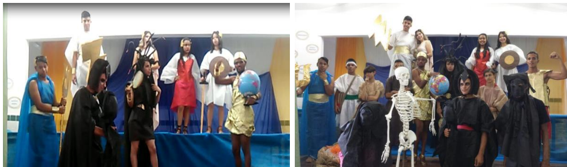
7. Encenação teatral com o tema “Deu a louca nos deuses”.

artísticas. Foi o momento em que todos os envolvidos no projeto utilizaram-se da cultura e da arte para o desenvolvimento de uma educação totalmente voltada à formação ética a partir de uma participação ativa, autônoma e consciente de todos os envolvidos.