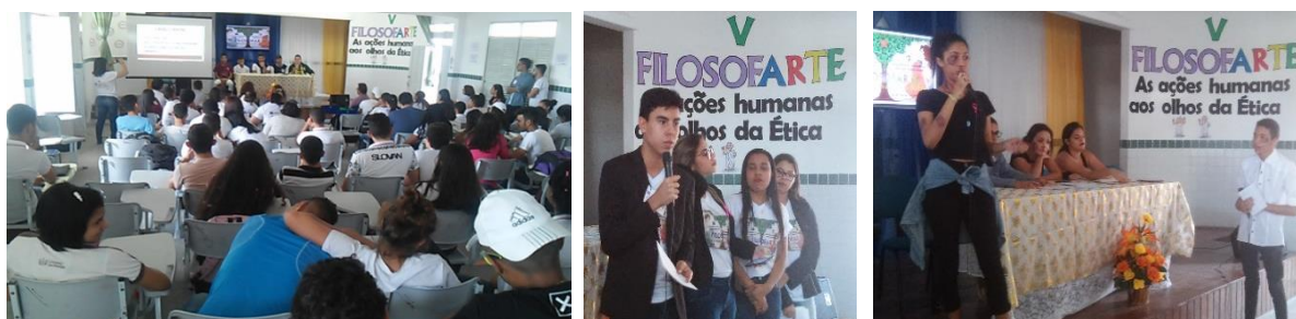
8. Apresentação de comunicações orais a toda comunidade escolar

Todo o processo desenvolvido pelos estudantes durante os três bimestres com o apoio constante dos pibidianos – UEPB, foi explanado numa semana dedicada à Filosofia que já acontece na escola há cinco anos. Foi neste momento que as discussões filosóficas ganharam destaque. As apresentações dos trabalhos ocorrem em dois momentos: um primeiro dedicado aos textos escritos e suas explanações através de comunicações orais, e um segundo, onde os estudantes participam de apresentações artístico-culturais. Através da música, de oficinas de grafite e das habilidades artísticas em encenações teatrais, os estudantes desenvolvem sua criticidade de forma lúdica e despertam dons que muitas vezes até desconheciam. Todo o processo de realização do projeto é divulgado nas mídias sociais pelos próprios estudantes e é no último dia do Filosofarte, após as apresentações das comunicações orais, que acontecem as apresentações culturais.