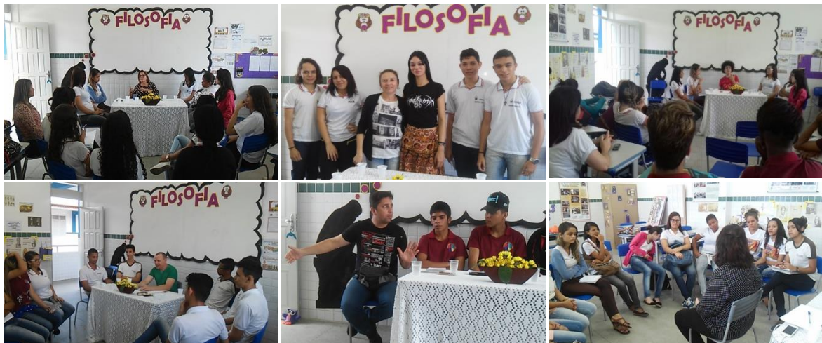
3. Entrevistas em sala de aula com especialistas nas temáticas propostas pelos estudantes

A relevância para o desenvolvimento deste projeto com todos os estudantes do Ensino Médio da Escola Cidadã Integral Nenzinha Cunha Lima, dá-se pelo desenvolvimento da autonomia intelectual e pensamento crítico, tão necessários para o domínio de algumas competências no século XXI. Pensando nisto, estratégias de ação foram desenvolvidas com o intuito de trazer especialistas, pessoas carregadas de conhecimentos a serem repassados aos estudantes a partir dos problemas que lançaram. Para isso, foi criado um espaço dedicado às entrevistas com os convidados. O uso das mídias foi fundamental nesta ação, pois o registro das informações foi peça-chave para o desenrolar de produções escritas relevantes e, conseqüentemente, das comunicações orais.