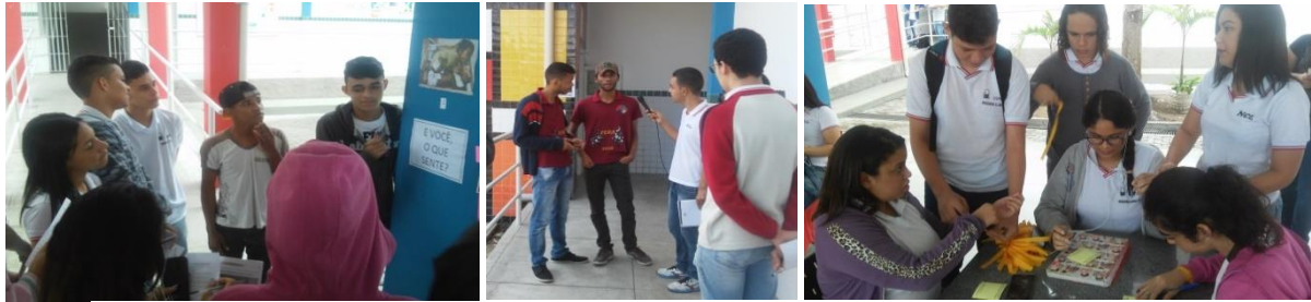
2. Pesquisas realizadas com estudantes sob a orientação dos pibidianos de Filosofia - UEPB

Estas atividades, iniciadas já no primeiro bimestre, foram desenvolvidas até a fase final da produção do artigo científico, apresentados na escola, na semana dedicada à Filosofia.