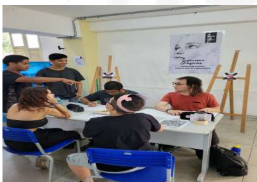
Figura 1: Venda de produtos

A ECIT Dr. Elpídio de Almeida - Estadual da Prata, localizada na R. Duque de Caxias nº 235, bairro Prata, onde participamos de forma efetiva na composição e elaboração de um conjunto de atividades dentre elas, destacamos: 14º Semana do Empreendedor, onde os alunos dividiram-se em grupos nas salas e ou em espaços dentro da escola, para empreender com produtos diversos como: lanches, brechós, bijuterias, games, entre outros, logo todo dinheiro arrecadado seriam deles próprios e ao final os alunos fariam um relatório para o professor responsável pela área estabelecida. Nesse evento os estudantes ocuparam-se com questões de Trabalho, Juventude e interações sociais, de tal modo que estão interconectados e desempenham papéis importantes no desenvolvimento pessoal e social dos indivíduos, assim a sociologia atua de maneira intrínseca.