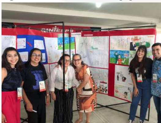
Figura 2: Enid- Produto Pedagógico