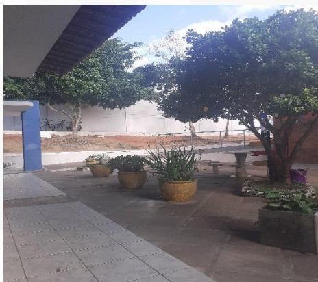
Figura 4: Bloco 01