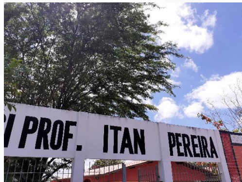
Figura 2: Frente da escola Prof o . Itan Pereira

A escola ECI Professor Itan Pereira se localiza na Rua Luiz Motta, S/N, Bairro Bodocongó, em Campina Grande – PB. A escola é distribuída em quatro blocos: bloco 01, estando presentes banheiros femininos e masculinos, refeitório, cozinha, salas dos professores e almoxarifado; bloco 02: secretaria, direção e sala do AEE (Atendimento Educacional Especializado), também tem o laboratório de informática e a sala do grêmio estudantil; bloco 03: salas de aula de 03 a 07; e o bloco 04: salas de aula de 08 a 12. Ainda tem o ginásio poliesportivo e dois laboratórios para ciências exatas e ciências da natureza fazerem o uso. A seguir, algumas imagens da escola: