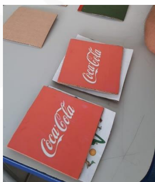
Figura 5: Jogo da memória

Nessa figura 2, a seguir, tem-se o jogo da memória, em que os alunos teriam que encontrar a figura “par” que ele tinha virado, as imagens presentes no jogo eram as grandes empresas transnacionais e a medida que ia se jogando, eles iam recordando de muitas transnacionais.