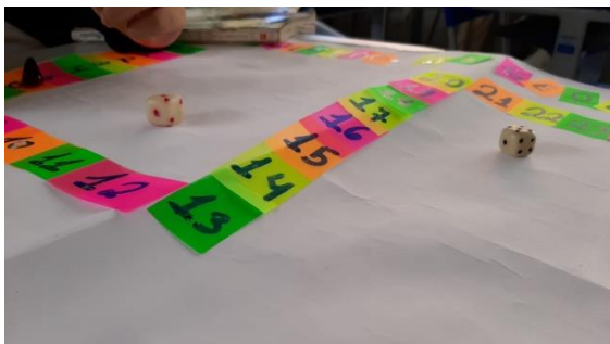
Figura 7: Tabuleiro Geográfico.

um tabuleiro de Geografia, com várias perguntas do processo de globalização para que fossem respondidos por eles, como forma de averiguar se estavam, de fato, compreendendo o assunto.