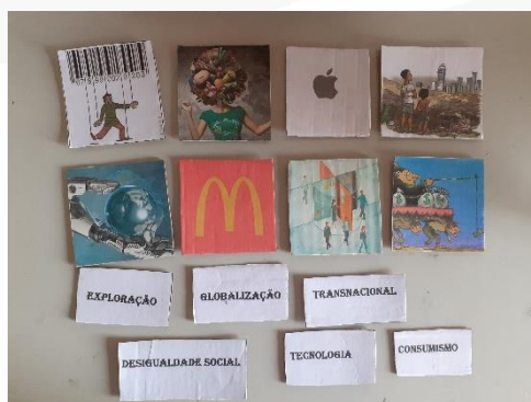
Figura 6: Jogo de associação de palavras a imagens

Na figura 3, abaixo, vê-se o jogo da associação de palavras a imagens, iam associando as palavras de acordo com as imagens, mostrando-se um jogo interessante para os estudantes.