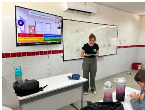
Imagem 8: residente participando do processo de ensino-aprendizagem no projeto.

A adição de residentes ao projeto foi fundamental. Além de proporcionar suporte prático, essa colaboração contribuiu significativamente para a formação dos residentes, oferecendo uma oportunidade prática de aplicar teorias pedagógicas em um contexto real. Esse envolvimento enriqueceu a experiência educacional, proporcionando uma diversidade de abordagens e perspectivas. Veja feedback no anexo 1.