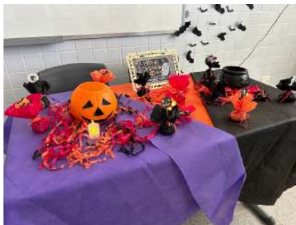
Imagem 1: primeiro dia do projeto.

além de adaptações audiovisuais. Esta abordagem permitiu explorar as diferentes dimensões das narrativas, incorporando discussões, debates e atividades escritas e orais. Os estudantes foram desafiados a não apenas compreender os textos em língua inglesa, mas também a aplicar o conhecimento em atividades práticas, como a criação de histórias, debates e interpretação de músicas.