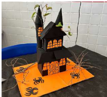
Imagem 4: maquete para representar a obra A Queda da Casa de Usher.

No segundo encontro, mergulhamos no poema "O Corvo" do mesmo autor. Foi destacada a importância da abordagem intertextual, conforme teorizado por Kristeva (1966), enquanto explorávamos como elementos de outras obras eram incorporados e reinterpretados. A aplicação da teoria de Eco (1962) sobre semiótica trouxe uma compreensão mais profunda da interpretação de sinais e símbolos na literatura, complementando a análise interdisciplinar entre música e poesia, como proposto por Eco (2009).