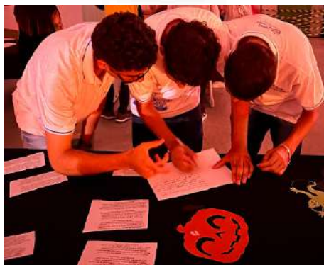
Imagem 9: alunos resolvendo as missões no dia da culminância.

Os resultados do projeto, não apenas em termos de melhoria nas habilidades de língua inglesa, mas também no aumento do interesse pela literatura e na capacidade de aplicar conceitos teóricos em contextos práticos, corroboram a eficácia dessa abordagem inovadora. A satisfação dos alunos e o feedback positivo da comunidade escolar são testemunhos tangíveis do impacto positivo do projeto.