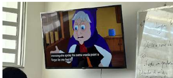
Imagem 6: recursos audiovisuais foram utilizados para dar suporte às aulas.

O quarto encontro foi um momento de consolidação, revisando as três obras estudadas. A aplicação do conceito de intertextualidade, conforme proposto por Julia Kristeva (1966), permitiu que os alunos identificassem conexões e paralelos entre as histórias. Essa análise aprofundada alinou-se à abordagem hermenêutica de Gadamer (1975), enfatizando a interpretação crítica e o diálogo intertextual na compreensão da literatura.