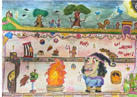
Imagem 3: começa a haver a introdução de elementos verbais na língua inglesa.

Os resultados alcançados foram evidentes através dos feedbacks dos alunos. Muitos demonstraram entusiasmo durante o projeto, destacando a empolgação no dia da culminância e o engajamento contínuo na leitura de obras literárias. A produção de finais alternativos para as obras estudadas evidenciou o desenvolvimento das habilidades de escrita, resultado das atividades de fixação propostas. Podemos observar nas produções iniciais.