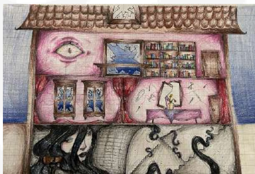
Imagem 5: criação de uma fase de jogo baseada no poema O Corvo.

No segundo encontro, mergulhamos no poema "O Corvo" do mesmo autor. Foi destacada a importância da abordagem intertextual, conforme teorizado por Kristeva (1966), enquanto explorávamos como elementos de outras obras eram incorporados e reinterpretados. A aplicação da teoria de Eco (1962) sobre semiótica trouxe uma compreensão mais profunda da interpretação de sinais e símbolos na literatura, complementando a análise interdisciplinar entre música e poesia, como proposto por Eco (2009).