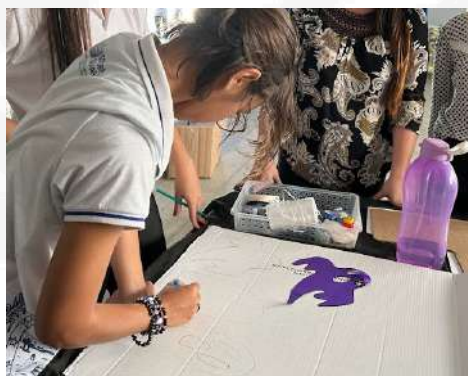
Imagem 7: início da produção para a culminância.

A culminância do projeto não foi apenas uma apresentação de aprendizados, mas sim a aplicação prática de todo o conhecimento adquirido. Criamos um ambiente cuidadosamente preparado, proporcionando aos alunos a oportunidade de participar de missões que integravam elementos das obras estudadas. Desde auxiliar personagens a encontrarem o caminho de volta para casa, conforme o conto de "João e Maria", até decifrar mensagens criptografadas baseadas na literatura de Edgar Allan Poe, cada missão exigiu a aplicação prática de conhecimentos literários e linguísticos.