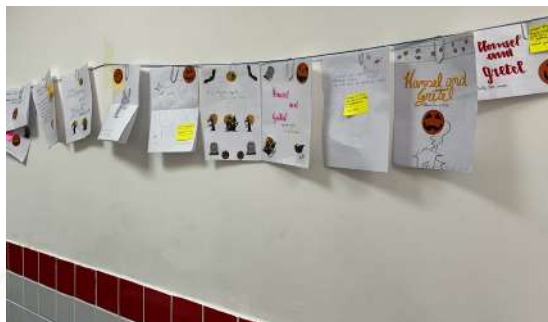
Imagem 12: varal com as produções finais dos alunos em língua inglesa.

A replicabilidade do "Explorando o Halloween" é uma perspectiva emocionante. A estrutura flexível, a abordagem interdisciplinar e a ênfase na aplicação prática de teorias literárias podem ser adaptadas para diferentes contextos educacionais e níveis de ensino. A inclusão de residentes, além de fortalecer a parceria entre teoria e prática, apresenta uma oportunidade valiosa para o desenvolvimento profissional de futuros educadores.