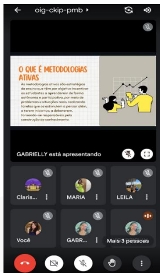
Figura 5: Reunião com a Preceptora do subgrupo.