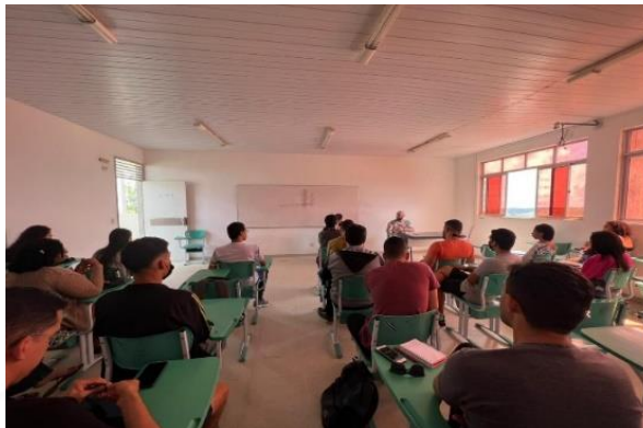
Figura 1: Reunião com o coordenador do PIBID.