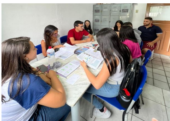
Figura 04: Reunião com a Preceptora do Subgrupo.