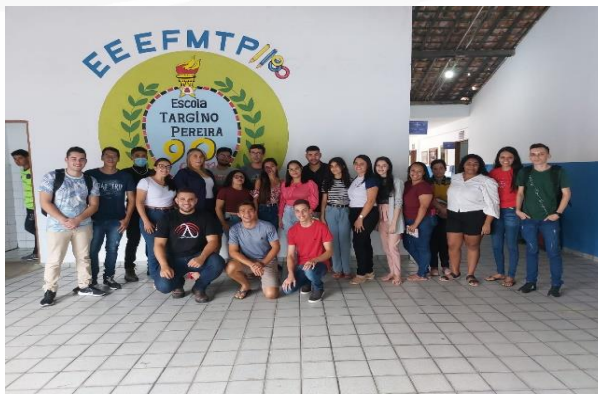
Figura 2: Reconhecimento da Escola