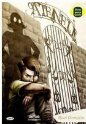
Figura 4 – Capa

Fonte: http://cultura.estadao.com.br/noticias/geral,versao-em-hq-de-o-ateneu-reve-drama-de-violento-rito-de-passage,908237