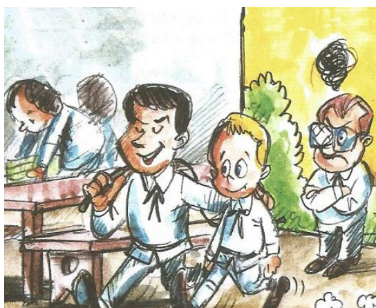
Figura 5 – As relações de dependência

Segundo Camil Capaz, que foi biógrafo de Pompeia (1863- 1895), trata-se de um "romance da reclusão que as famílias ricas do fim do Império impunham a seus filhos, no intuito de temperá-los para os desafios da vida adulta".