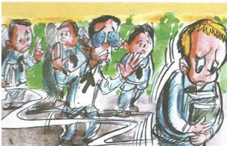
Figura 6 – O Desamparo