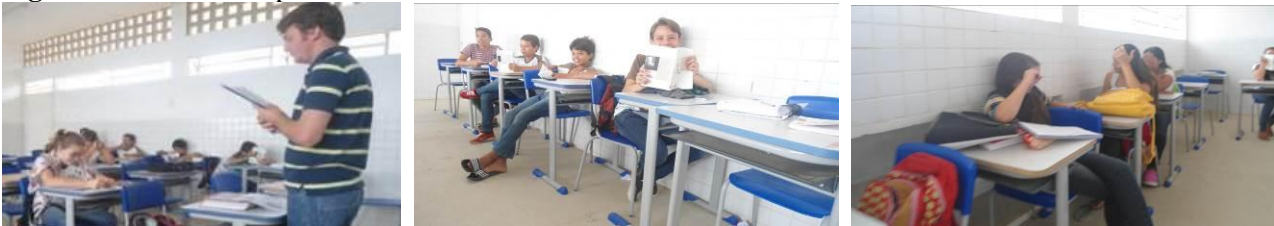
Figura 2 - Leitura compartilhada da obra Vidas Secas com os alunos do 7º Ano

Ao iniciar a leitura, percebeu-se que alguns alunos possuem deficiências na leitura, sendo mais notória nos alunos que afirmaram não gostar de ler, constatando-se, portanto, a pouca convivência com textos e pouco desenvolvimento das habilidades leitoras. Alguns alunos, contudo, demonstraram desenvoltura na leitura, bem como na interpretação das situações vivenciadas na obra. De modo geral, mesmo os alunos que apresentaram dificuldade na leitura, não impuseram resistência em compartilhar momentos de leitura com os demais colegas, o que é representativo, pois em alguns casos a dificuldade de leitura, pode ser uma barreira ao desenvolvimento dessa competência, principalmente por que isso pode representar algum constrangimento e disso haver conflitos, o que não se constatou em nenhuma das situações vivenciadas ( Figura 2 ).