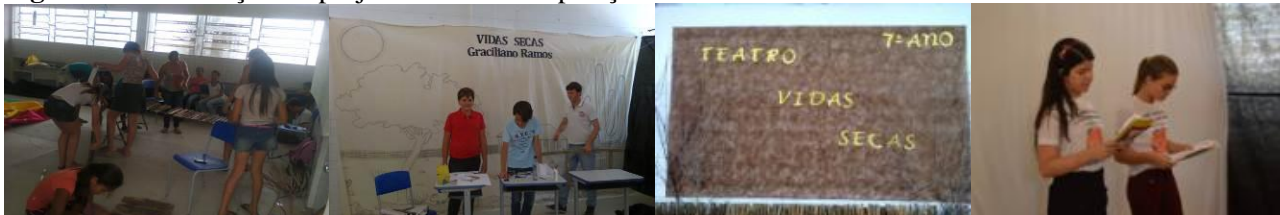
Figura 5: Socialização do projeto durante a Exposição Científica e Cultural

Para o desenvolvimento desta atividade procedeu-se primeiramente a elaboração e estudo de um roteiro teatral que contemplou os principais aspectos abordados na obra literária, contudo esta atividade não foi fácil uma vez que a complexidade da discussão da obra e a sua dimensão torna a tarefa de síntese muito difícil. Diante desse quadro, contou-se com o auxílio da professora de Língua Portuguesa da turma do 7º ano na organização dos materiais necessários a realização da peça teatral. Após as discussões, com a participação dos alunos foi elaborado um roteiro teatral contemplando VI Atos, a saber, (I- Mudança, II- Inverno, III- Prisão, IV- Contas, V- A morte de balia e VI- Fuga). No dia da apresentação todos se fizeram presentes e contribuíram para que o momento acontecesse como planejado. Podia se ver que todos dividiam o mesmo sentimento de responsabilidade e de protagonismo de forma que a interação do público presente com os mesmos ocorreu em todos os momentos ( Figura 5 ).