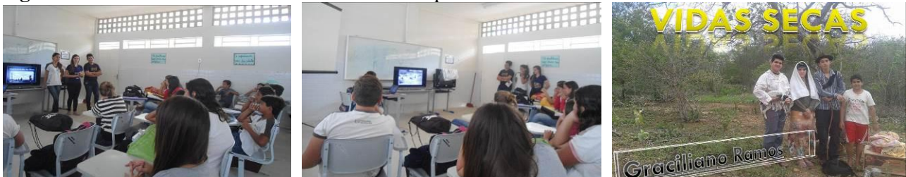
Figura 3 – Discussão da obra Vidas Secas mediada pelos alunos do 3º Ano Médio

Este trabalho foi iniciado na Sala de Vídeo da escola e contou com a importante participação dos alunos da turma do 3º ano Médio do turno manhã que, a partir de um trabalho realizado na disciplina de Língua Portuguesa com ênfase na obra Vidas Secas , introduziram e discutiram os elementos principais presentes no romance, além de exibirem um Curta-metragem produzidos pela referida turma como releitura da obra Vidas Secas ( Figura 3 ).