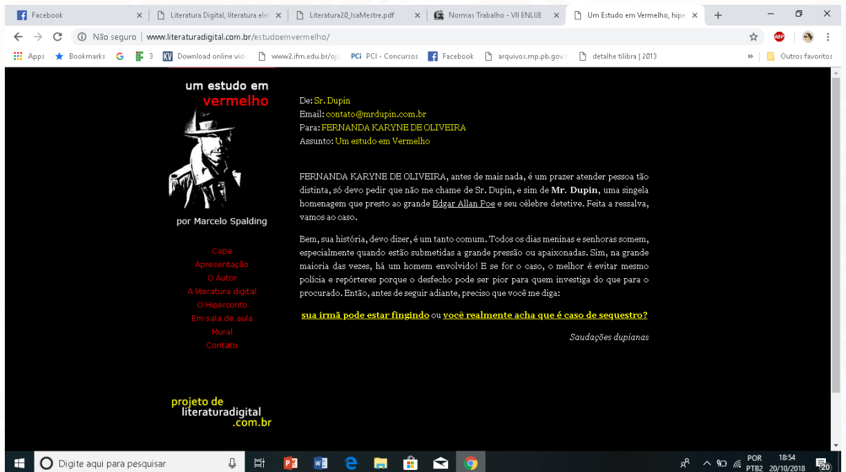
Figura 2: Interface 3