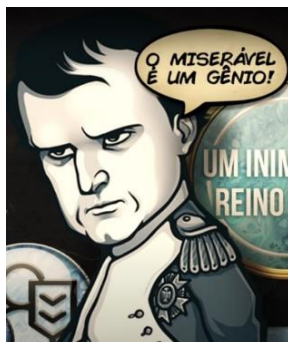
Figura 3: print do vídeo