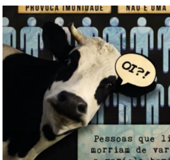
Figura 1: print do vídeo