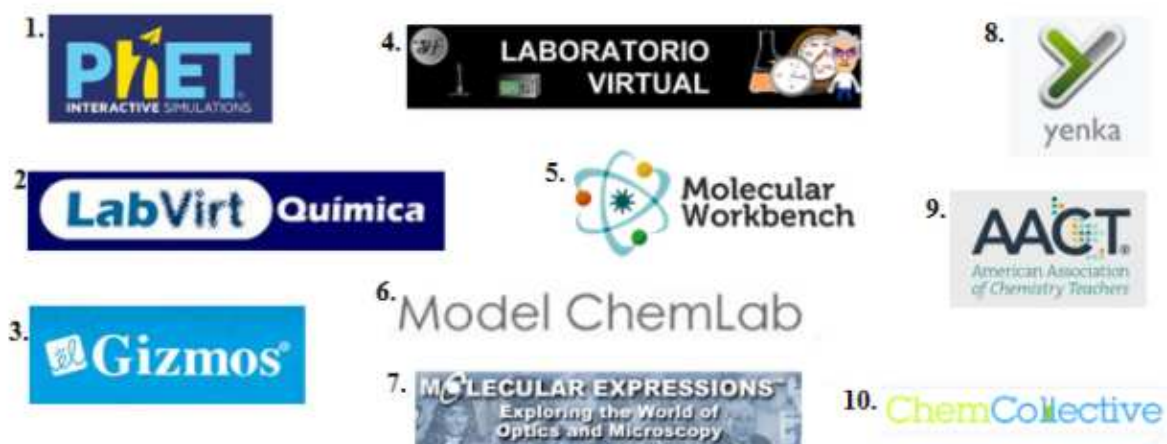
Figura 1: Logo dos softwares de simulações utilizadas como base para investigar o conhecimento dos professores quanto estes recursos.

Por fim, foi solicitado os dados de perfil (nome, e e-mail opcionais, mais áreas de formação, meio de atuação e ano de início da atividade docente como itens obrigatórios.