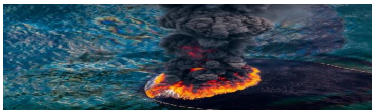
Figura 02: Desastre no Golfo do México, em 2010, de Daniel Beltra/ www.populationspeakout.org .

Fonte: https://artsandculture.google.com/story/SQUBWNrRk-XCIw (2016).