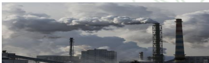
Figura 03: Fábrica de carvão em Yulin, China, de Nian Shan/Greenpeace.

Fonte : https://artsandculture.google.com/story/SQUBWNrRk-XCIw (2016).