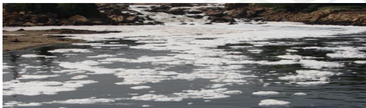
Figura 05: Rio Tietê em Salto, interior de São Paulo, de Eurico Zimbres (CC BY-NC 2.5).

Fonte: https://artsandculture.google.com/story/EAXRknuhtGpZJw (2016).