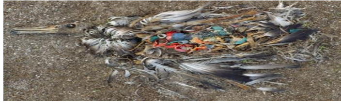
Figura 04: Pássaro morto por plástico, de Cris Jordan/www.populationspeakout.org.

Fonte: https://artsandculture.google.com/story/SQUBWNrRk-XCIw (2016).