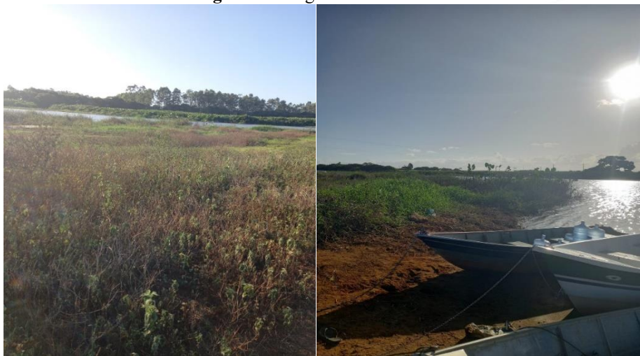
Figura 2: Margens do Rio Comboios.

A figura 2 apresenta a situação das margens do rio, onde visualiza-se uma vegetação composta por plantas herbáceas e arbóreas. Essa vegetação representa a mata ciliar, que é um tipo de cobertura vegetal nativa, que fica às margens de rios, igarapés, lagos, olhos d'água e represas. A supressão desta vegetação traz enormes consequências para o rio e toda a biodiversidade. O Rio Comboios integra o canal Caboclo Bernardo, que possui ligação com o Rio Doce. Desde 2015, o rio local sofre o impacto decorrente da lama da Samarco, que atingiu toda a Bacia Hidrográfica do Rio Doce no estado. As consequências atingem esferas ambientais, econômicas e sociais. Além disso, há muitos empreendimentos industriais cadastrados no território, sendo 16 só na região de Comboios (INCAPER, 2020).