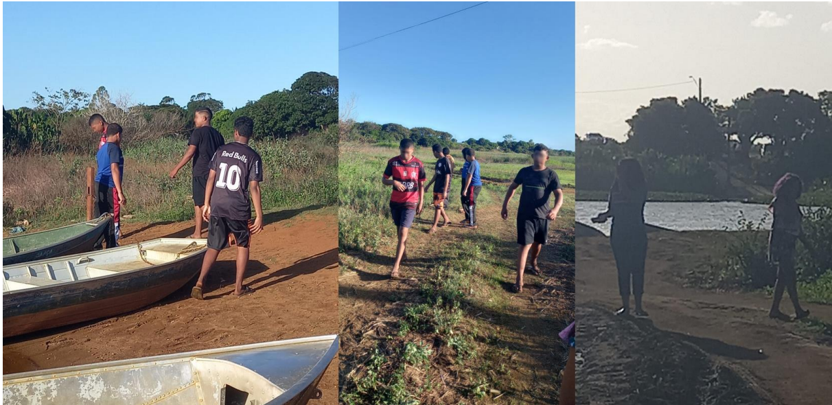
Figura 3: Estudantes explorando o local durante a aula de campo.

Daí a importância de ações em prol da educação ambiental, a fim de conscientizar os estudantes quanto a necessidade de preservação, remediação e recuperação da área degradada. Durante a aula de campo (Figura 3), os alunos observaram algumas áreas com assoreamento. Quando questionados sobre as causas dessas alterações, citaram o desmatamento da mata ciliar e o pisoteio do gado, aspectos estudados nas aulas teóricas. Além disso, com base na observação do local, os estudantes indicaram o cultivo de cana-de-açúcar e mandioca. A partir daí, foi feita uma reflexão sobre a importância da agricultura para a subsistência da comunidade, porém com ênfase nas ações sustentáveis, de modo que o cultivo do alimento não prejudique o ambiente.