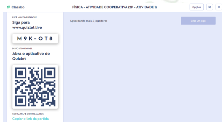
Figura 3: Página principal do Quizlet Live para organização das equipes.